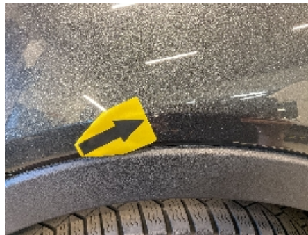
20. Lakk / karosseri utvendig