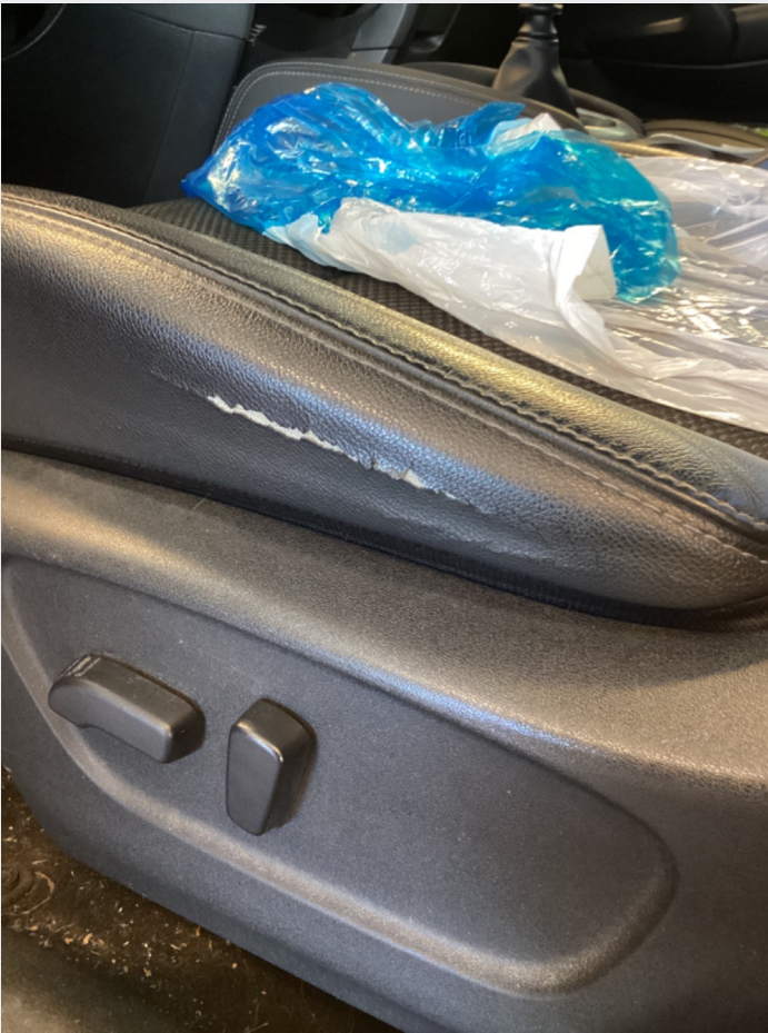
4.5 Sprekk fører sete