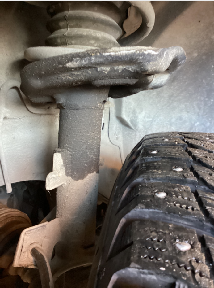
8.6 Svetting demper v f, ok funksjon