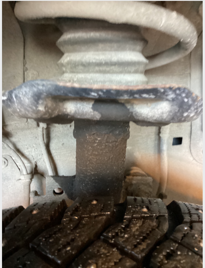
8.6 Svetting demper v f, ok funksjon