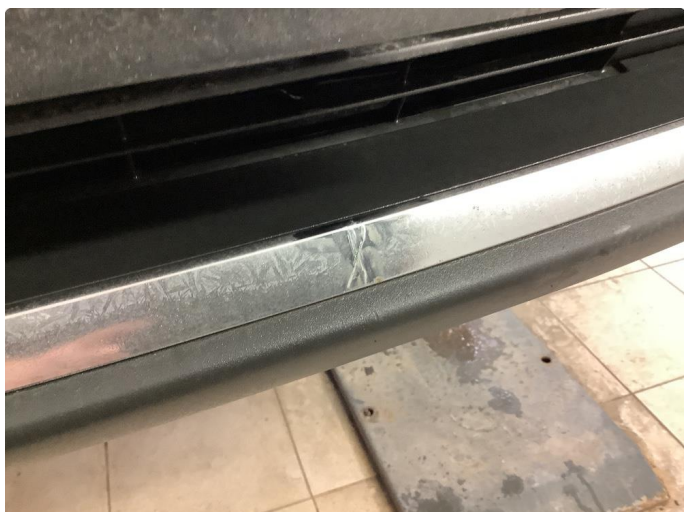
1.1 Lister skadet/mangler/ Sprekk i krom list nede på front fanger