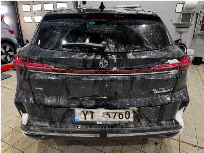
1.1 Noen vaskestriper