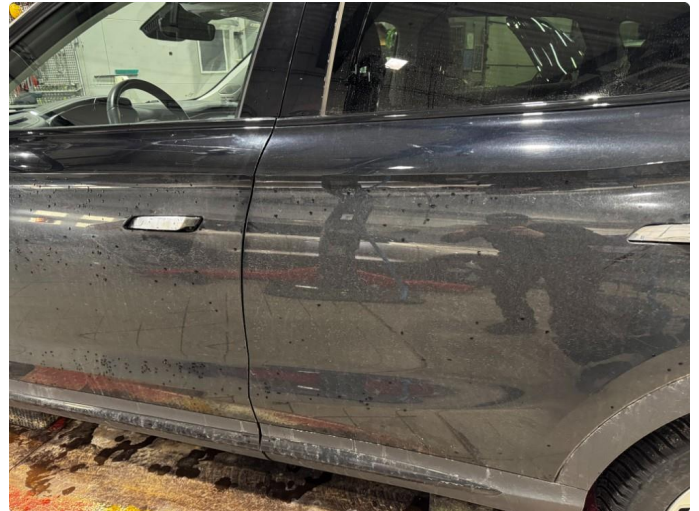
1.1 Noen vaskestriper