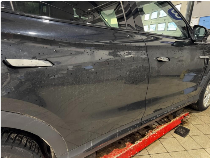
1.1 Noen vaskestriper