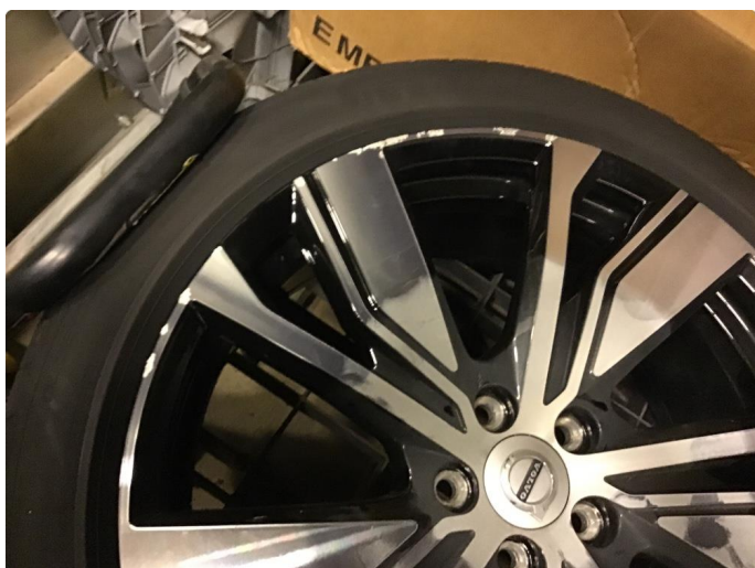
1.3 Skade på felg