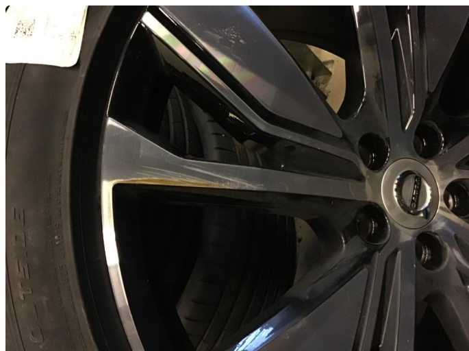
1.2 Skade på felg