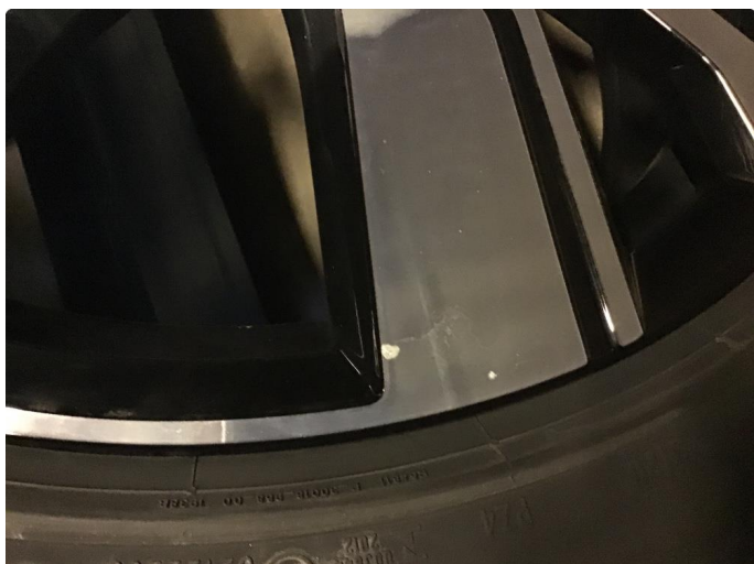
1.1 Skade på felg