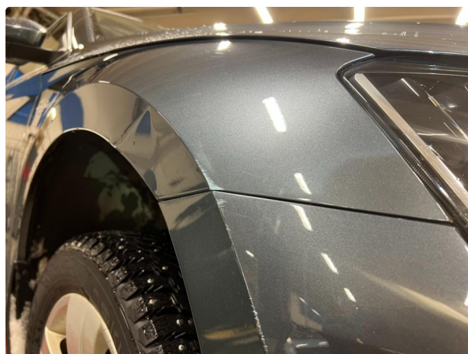
1.3 Bulk med lakkskade