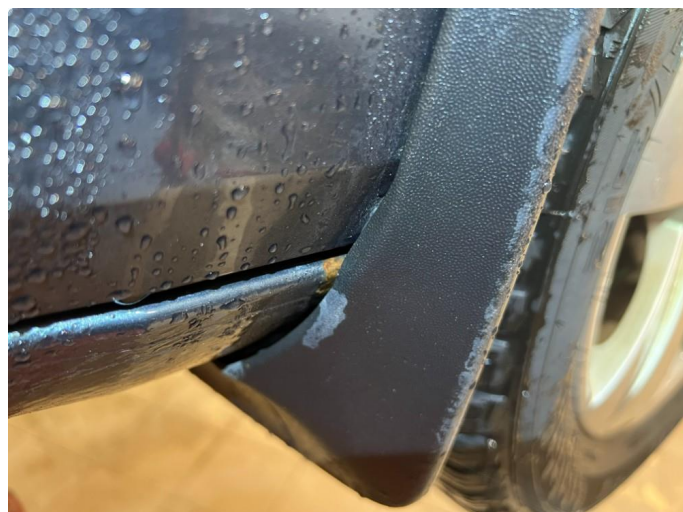
1.1 Noe korrosjon/rust ved skvettlapper