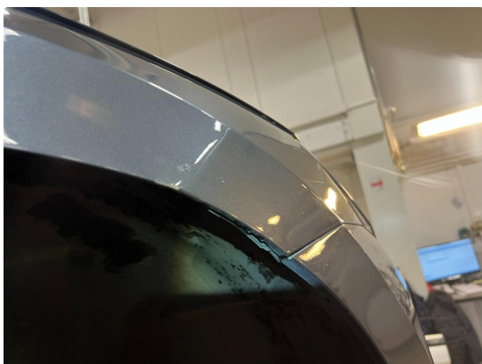
1.3 Bulk med lakkskade