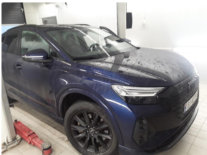
1.1 SOS varsling