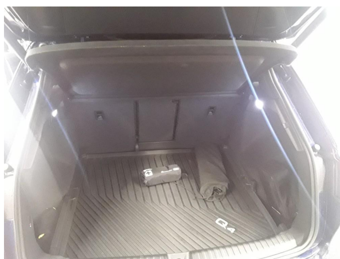
1.1 SOS varsling