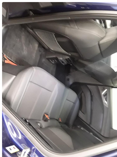
1.1 SOS varsling