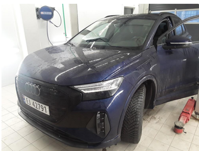
1.1 SOS varsling