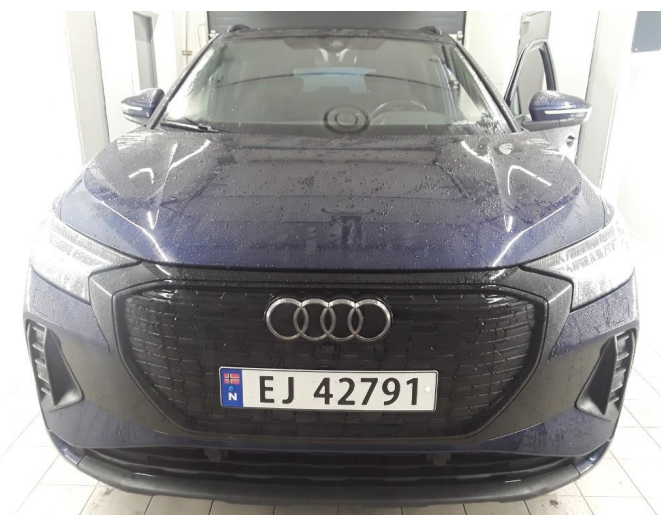
1.1 SOS varsling