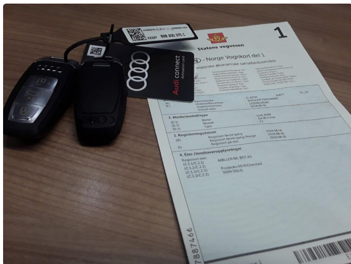
1.1 SOS varsling