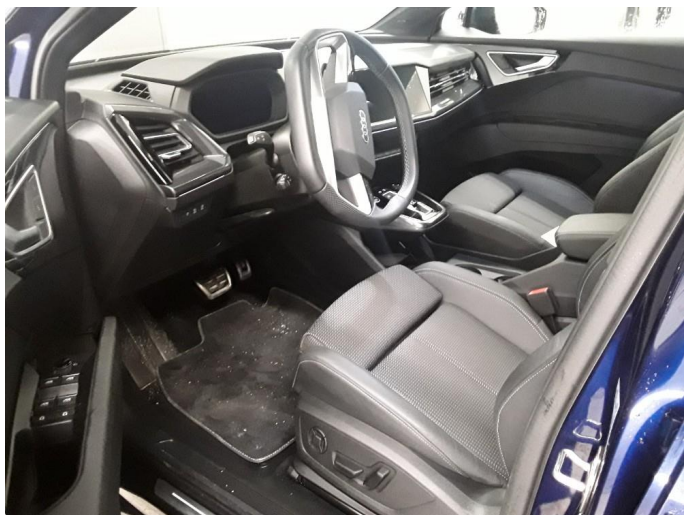
1.1 SOS varsling