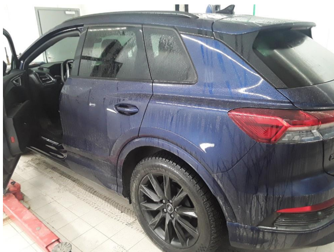
1.1 SOS varsling