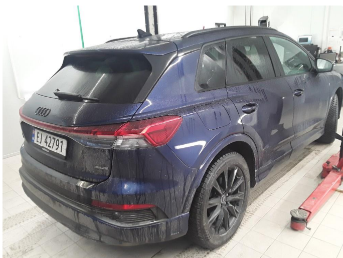
1.1 SOS varsling