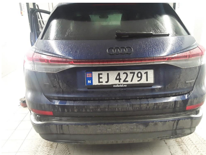
1.1 SOS varsling