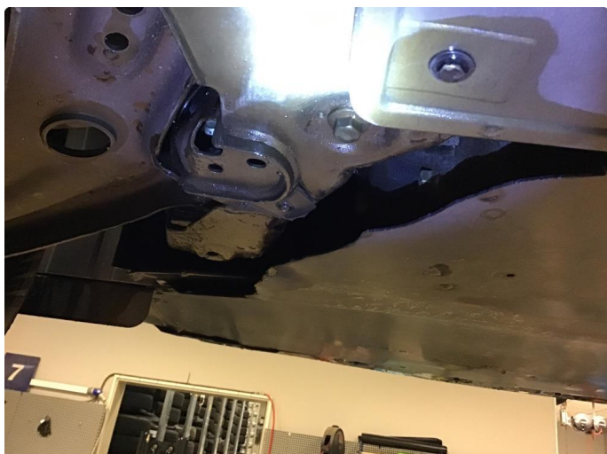
1.1 Beskyttelsesplate skadet/mangler