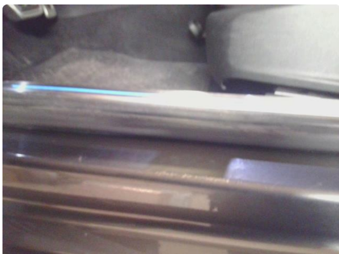
1.3 Slitt innsteg