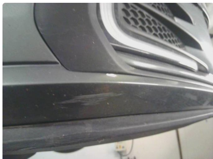
1.4 Ripe/lakk (halv del)