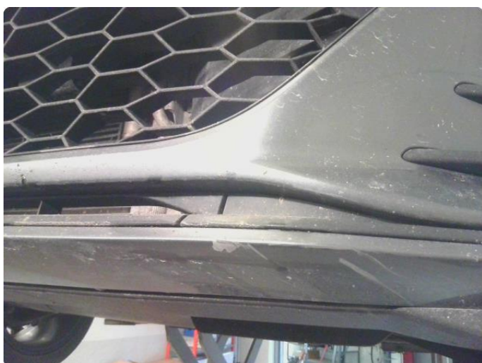
1.4 Ripe/lakk (halv del)