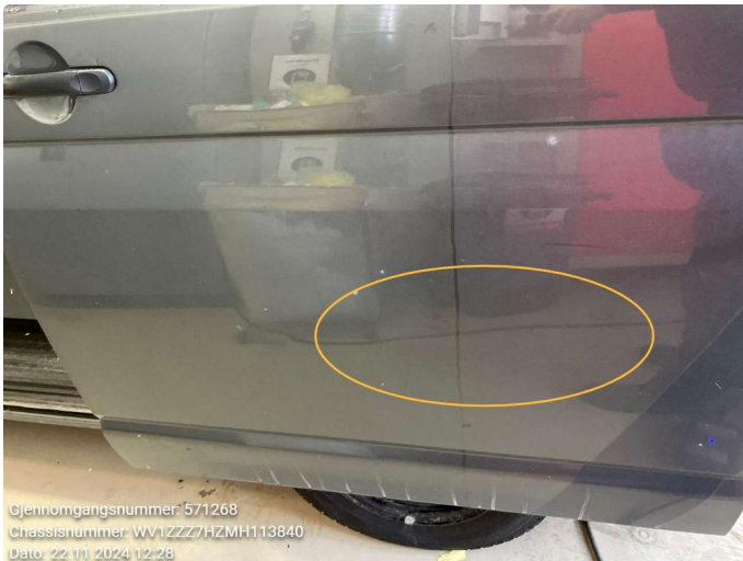
1.2 Noen bulker