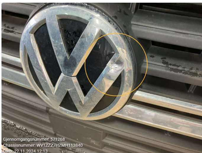
1.5 Skade emblem