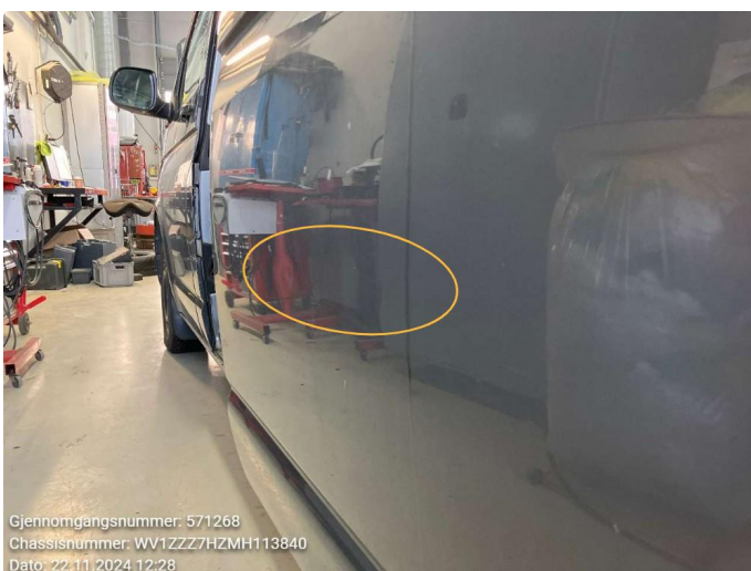
1.2 Noen bulker