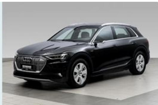
FRYDENBØ | Ålesund

Se mer om forutsetningene for vurderingen og andre vilkår på siste side.