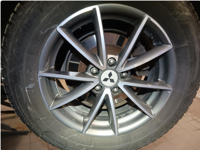
1.1 Bruksmerke felg