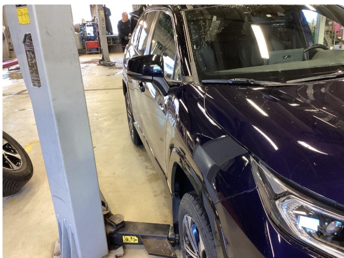
1.1 Parkerings bulk på passasjerdør