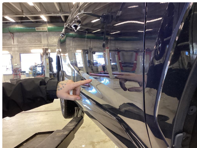
1.1 Parkerings bulk på passasjerdør