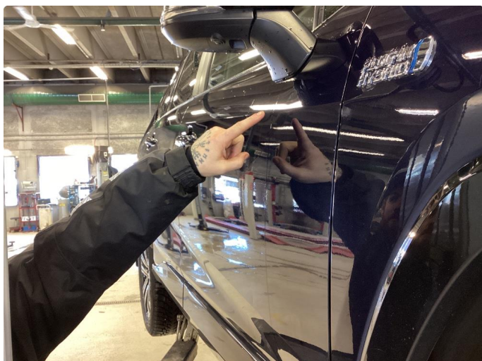
1.1 Parkerings bulk på passasjerdør