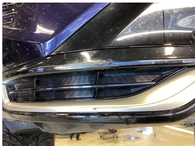
1.2 Bruksmerker Høyre foran nederst på fanger