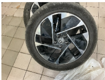
35. Ekstra hjulsett