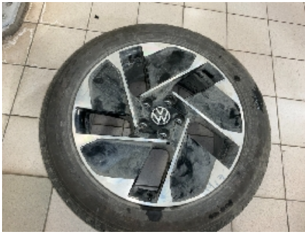
37. Ekstra hjulsett