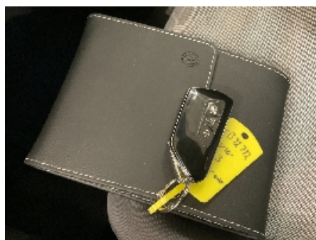
23. Nøkler / Utstyr