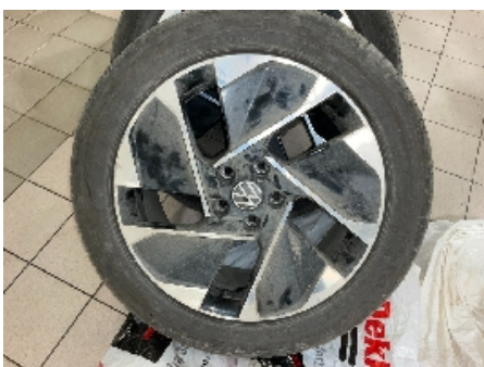
34. Ekstra hjulsett