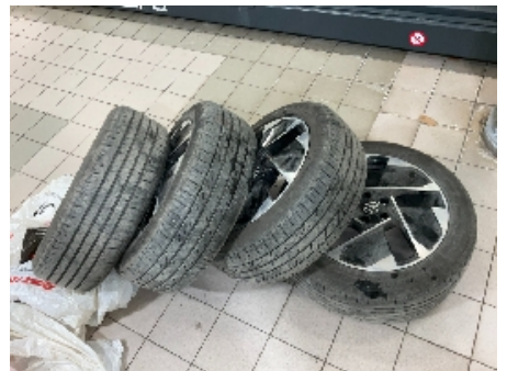
33. Ekstra hjulsett