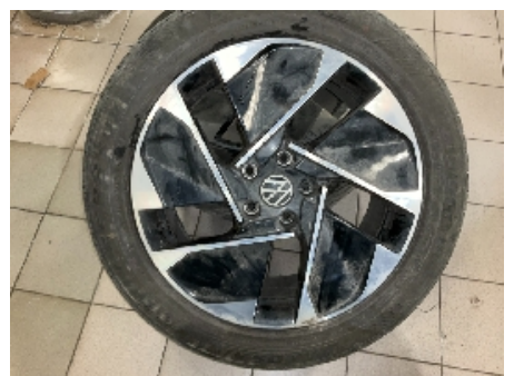
36. Ekstra hjulsett