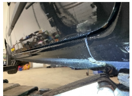
6. Lakk / karosseri utvendig