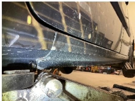
11. Lakk / karosseri utvendig