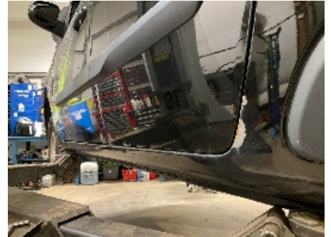
9. Lakk / karosseri utvendig