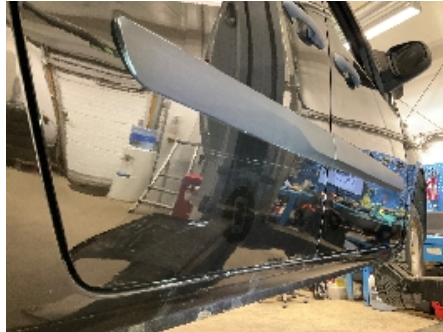
8. Lakk / karosseri utvendig