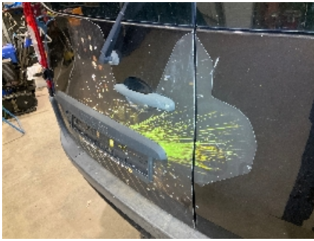
13. Lakk / karosseri utvendig