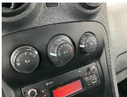
23. Luftdyse kupé