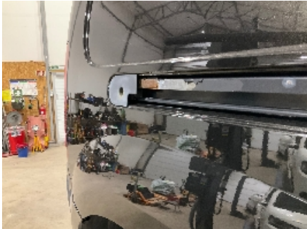
7. Lakk / karosseri utvendig