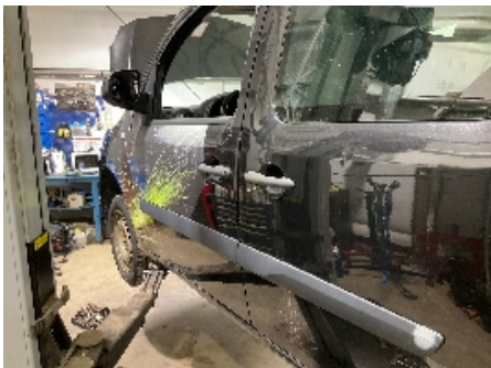
10. Lakk / karosseri utvendig