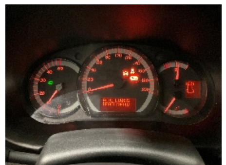
36. Varsellamper utvidet