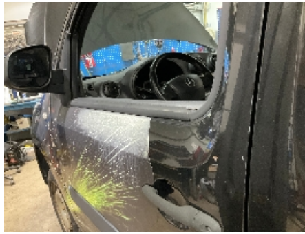
14. Lakk / karosseri utvendig