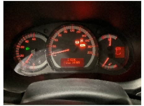
39. Varsellamper utvidet