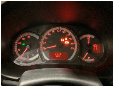
37. Varsellamper utvidet