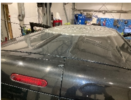
22. Lakk / karosseri utvendig