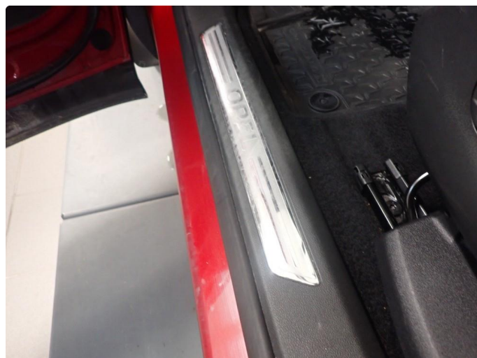
1.2 Slitte instegslister begge sider foran