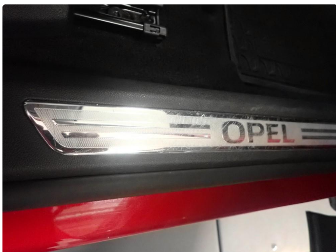
1.2 Slitte instegslister begge sider foran