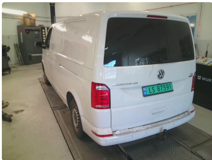
3.1 Diverse riper og steinsprut rundt på bilen