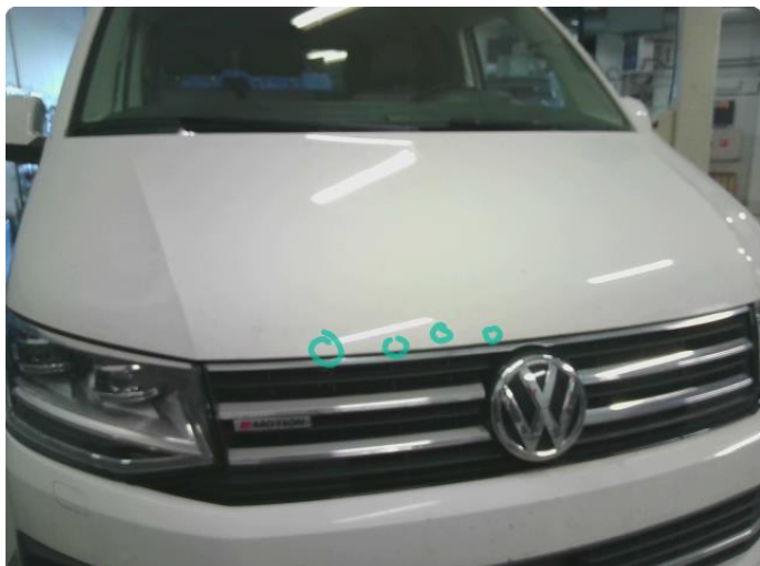
1.1 Noe steinsprut med rust