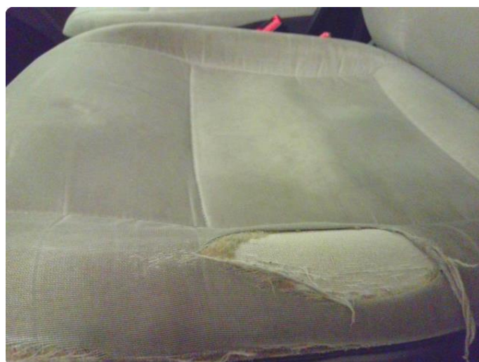
2.1 Skade på setetrekk