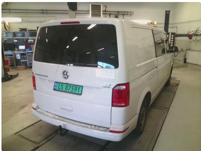
3.1 Diverse riper og steinsprut rundt på bilen