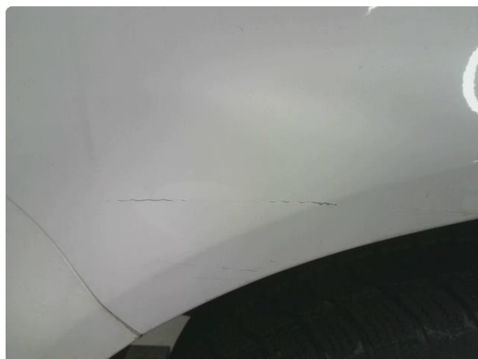
1.4 Ripe(r) ned til grunning