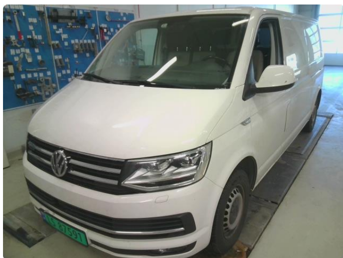
3.1 Diverse riper og steinsprut rundt på bilen