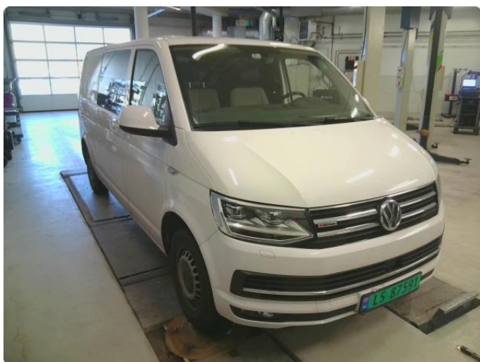
3.1 Diverse riper og steinsprut rundt på bilen