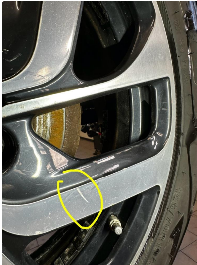
1.1 Slitt ihht alder og km