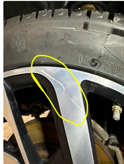
1.1 Slitt ihht alder og km