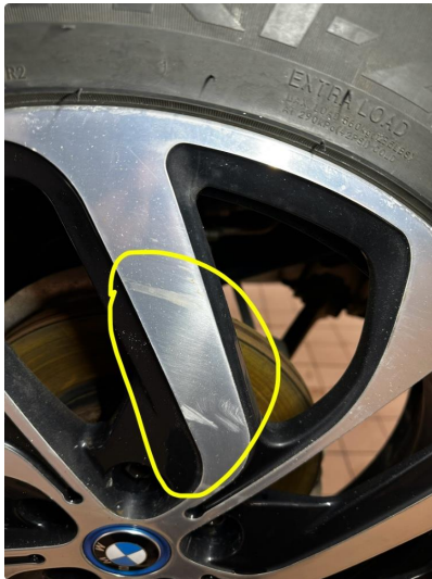
1.1 Slitt ihht alder og km