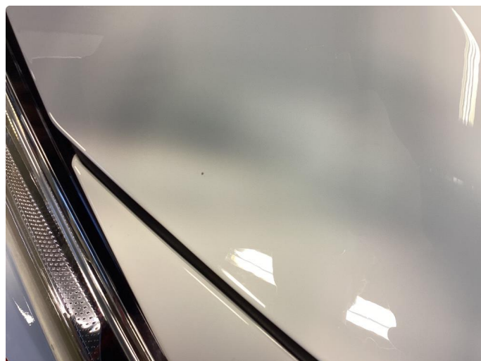
1.1 Div små steinspruter på panser