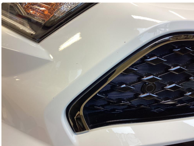
1.2 Div små steinspruter støtfanger foran