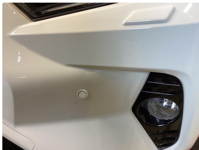
1.2 Div små steinspruter støtfanger foran