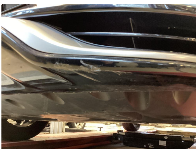
1.3 Liten Skade nedre støtfanger venstre foran