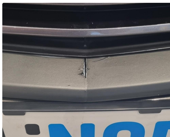
2.2 Crome-lister og takrails er foliert sort. Ikke utført av fagpersoner