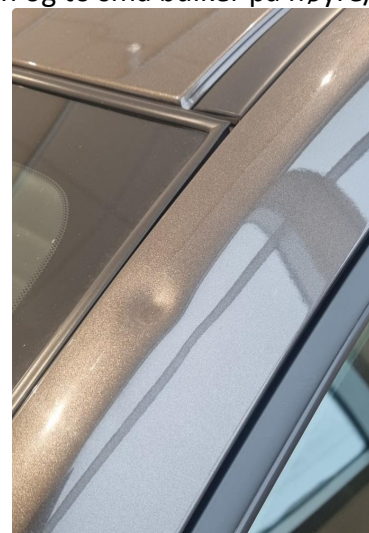
1.3 Bulk i A-stolpe på førerside