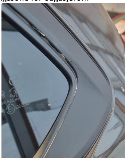
2.2 Crome-lister og takrails er foliert sort. Ikke utført av fagpersoner