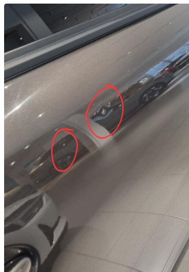
1.1 Ripe inn til grunning på passasjerdør høyre/foran og to små bulker på høyre/bak