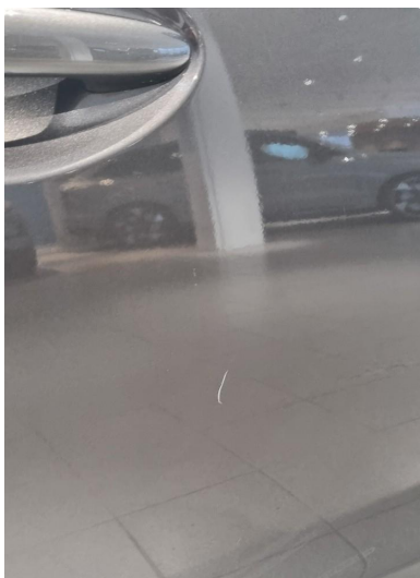
1.1 Ripe inn til grunning på passasjerdør høyre/foran og to små bulker på høyre/bak