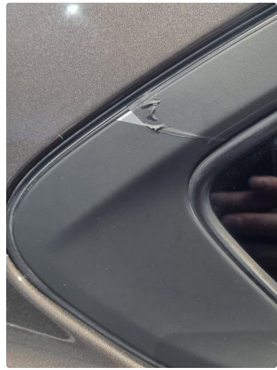
2.2 Crome-lister og takrails er foliert sort. Ikke utført av fagpersoner