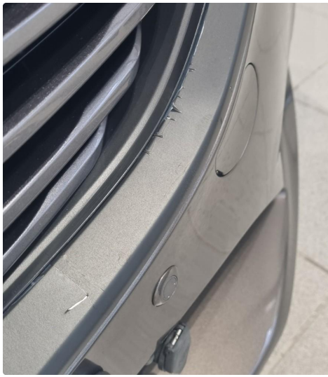
2.2 Crome-lister og takrails er foliert sort. Ikke utført av fagpersoner