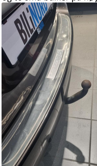
1.2 Endel bulker på beskyttelsesplate i innlastingszone for bagasjerom