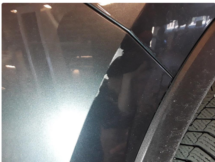
1.6 Noe riper.