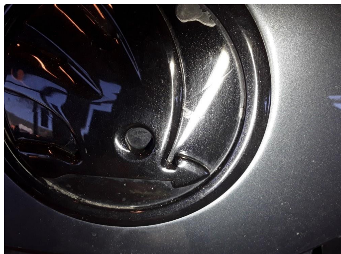
1.2 Noe lakkflask emblem.