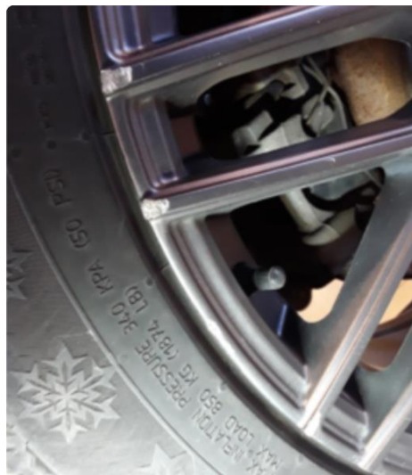
1.5 Noe kantkjørt vinterfelg.