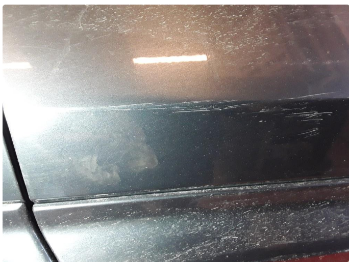
1.3 Liten steinsprut med korrosjon og noe riper.