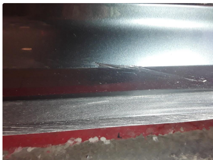
1.3 Liten steinsprut med korrosjon og noe riper.