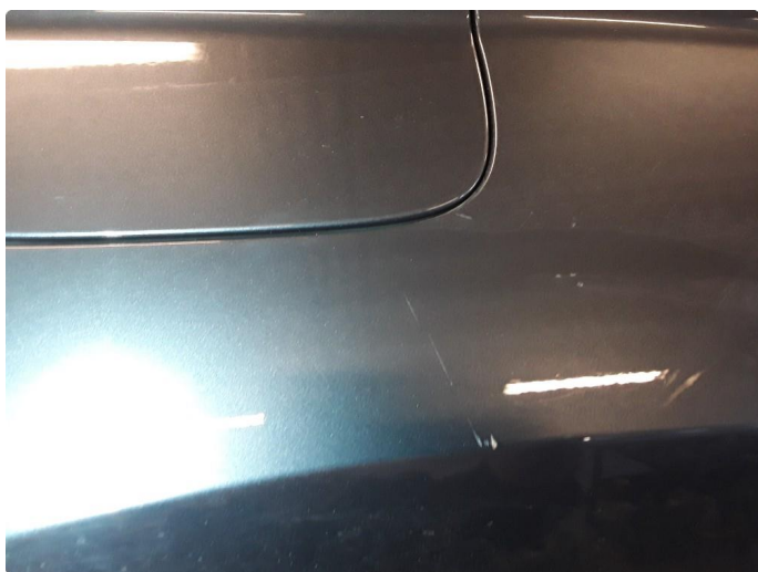
1.4 Noe riper.