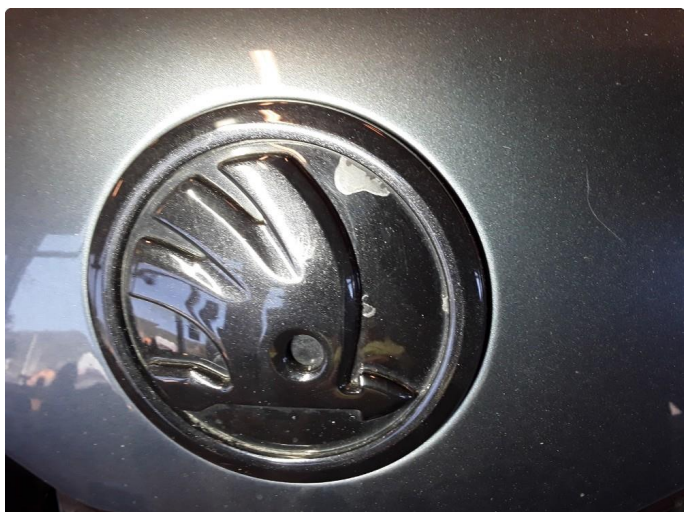
1.2 Noe lakkflask emblem.