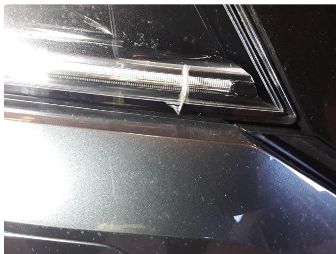
2.1 Liten sprekk.