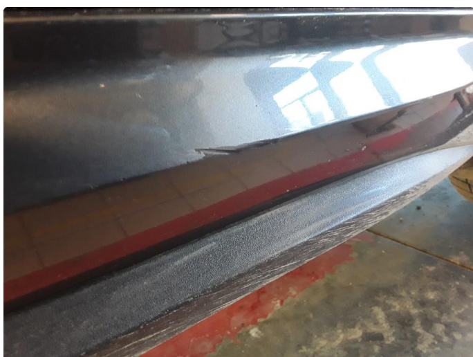
1.3 Liten steinsprut med korrosjon og noe riper.