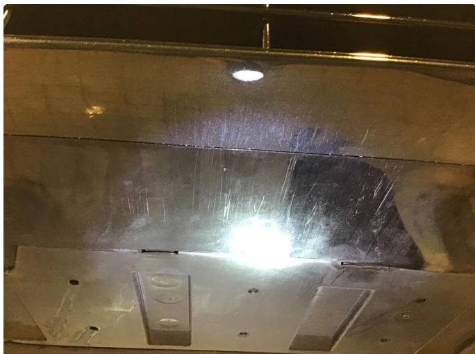
1.1 Skrubbskader underkant