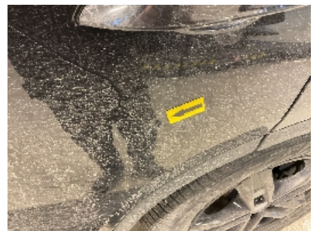
24. Lakk / karosseri utvendig