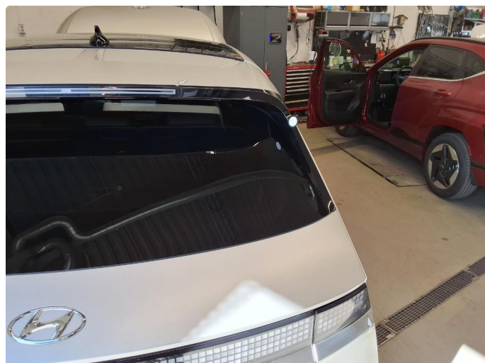
1.1 Ripe, ikke sjenerende