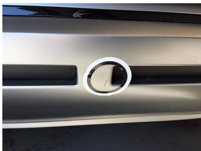
1.2 Ripe, ikke sjenerende