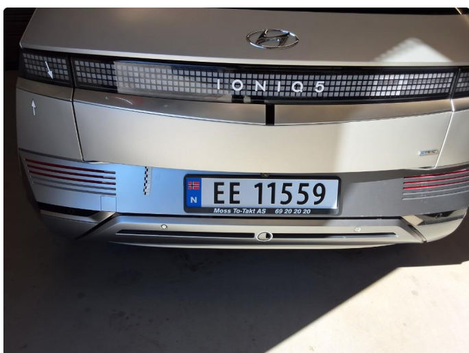
1.2 Ripe, ikke sjenerende