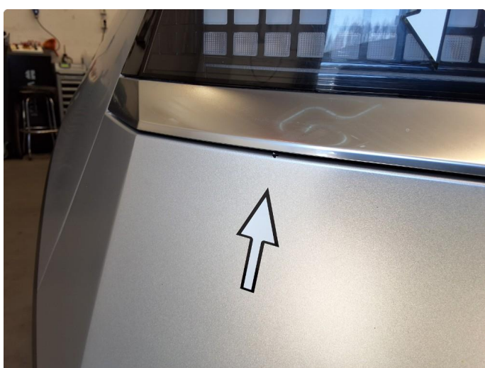
1.2 Ripe, ikke sjenerende