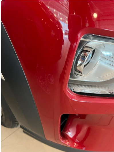
1.1 Lakkskade på støtfanger H.F- Utbedret med pensling