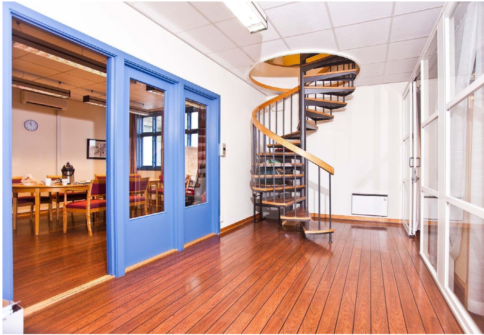
Konferanserom til venstre, kontor til høyre