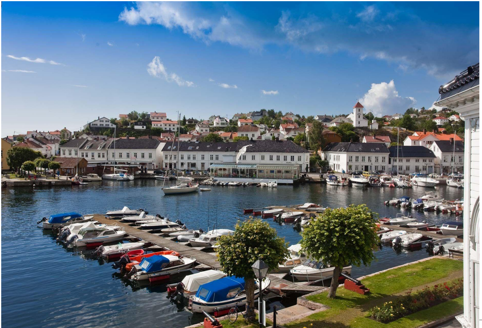
Under: Upåklagelig utsikt fra bygget....