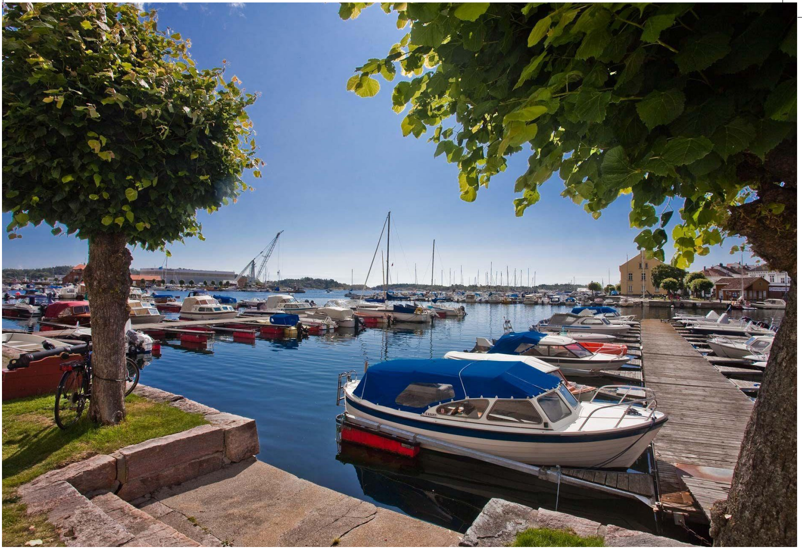
Over: Sommerstemning rett ved eiendommen