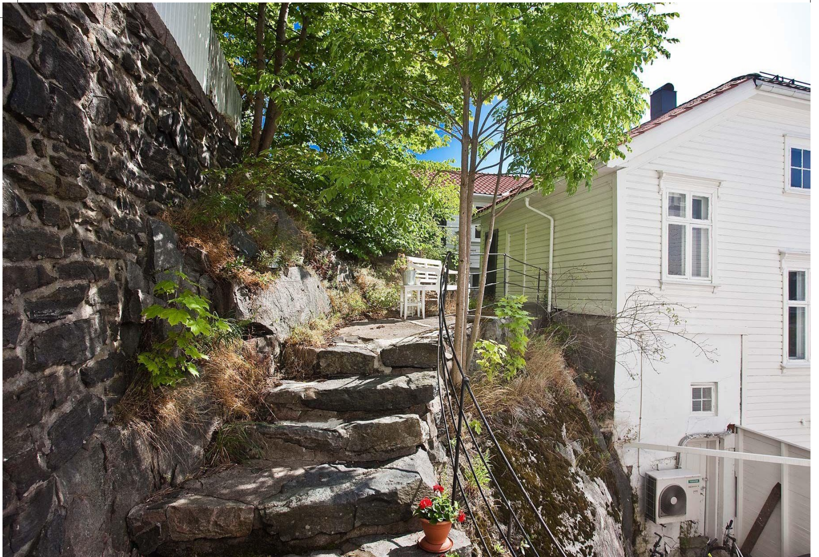
Adkomst via trapper til bakhagen