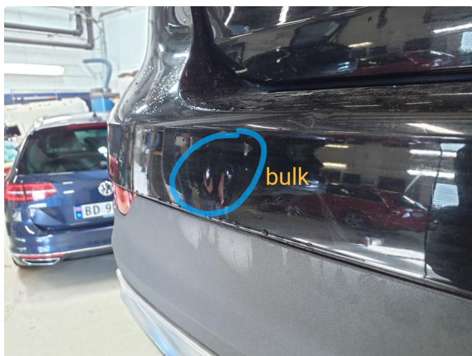
1.6 Ripe(r) ned til grunning