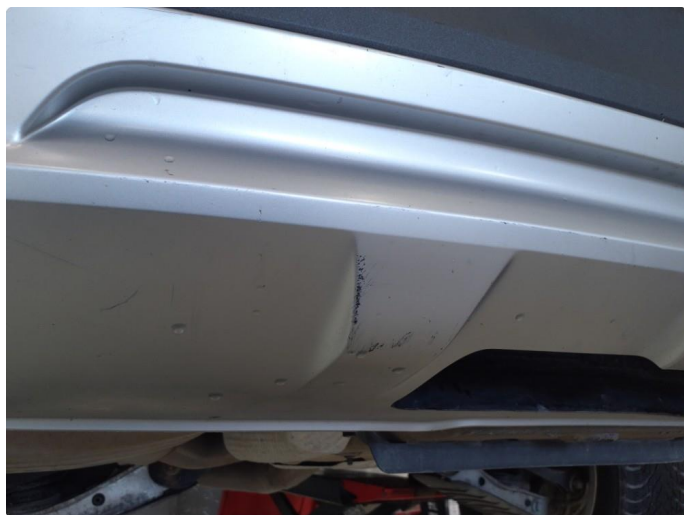
1.6 Ripe(r) ned til grunning