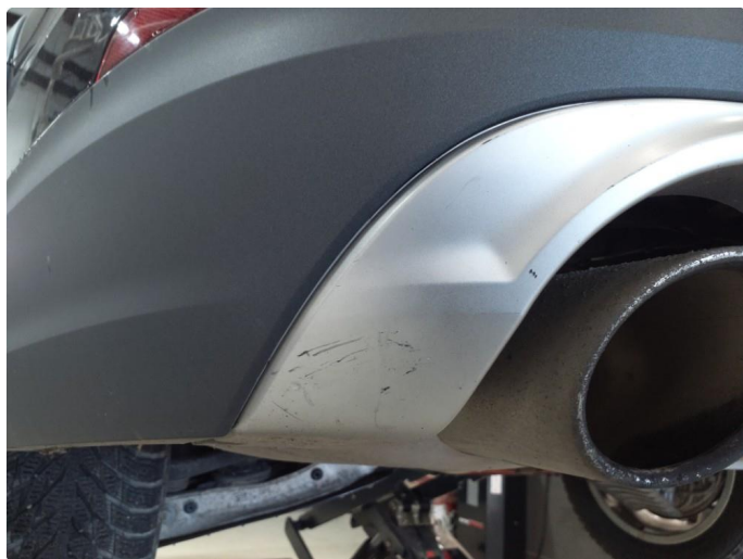
1.6 Ripe(r) ned til grunning