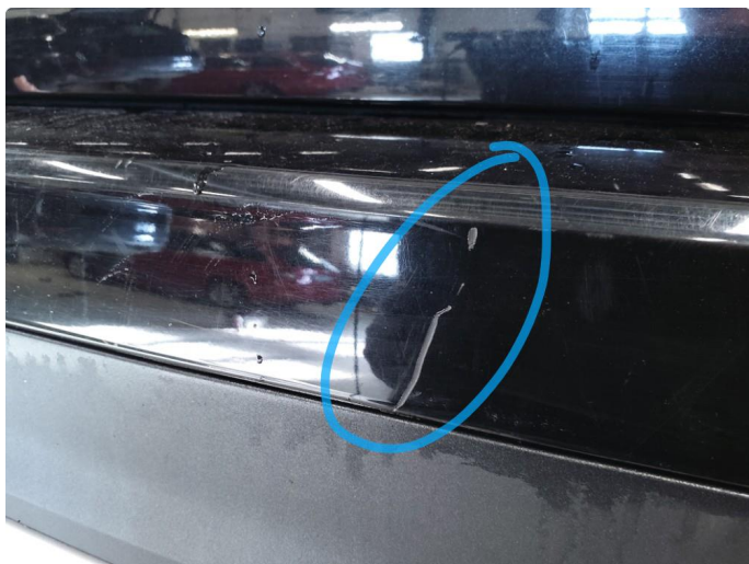
1.6 Ripe(r) ned til grunning