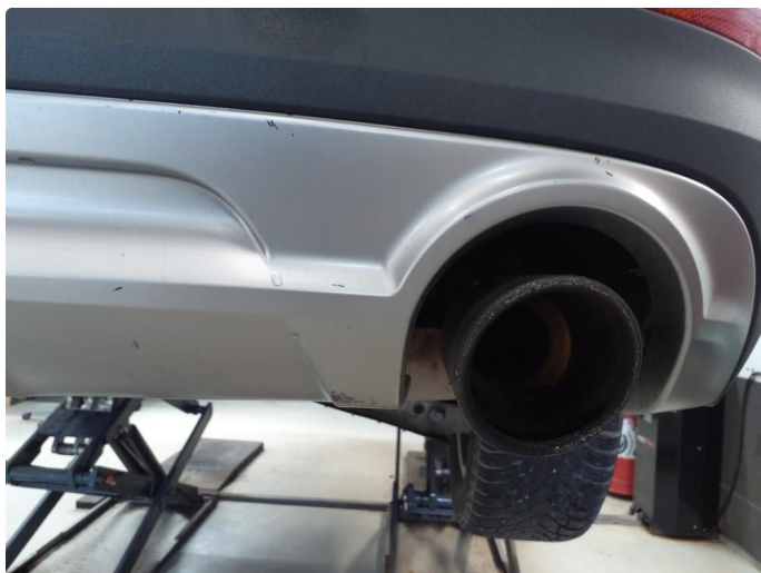
1.6 Ripe(r) ned til grunning