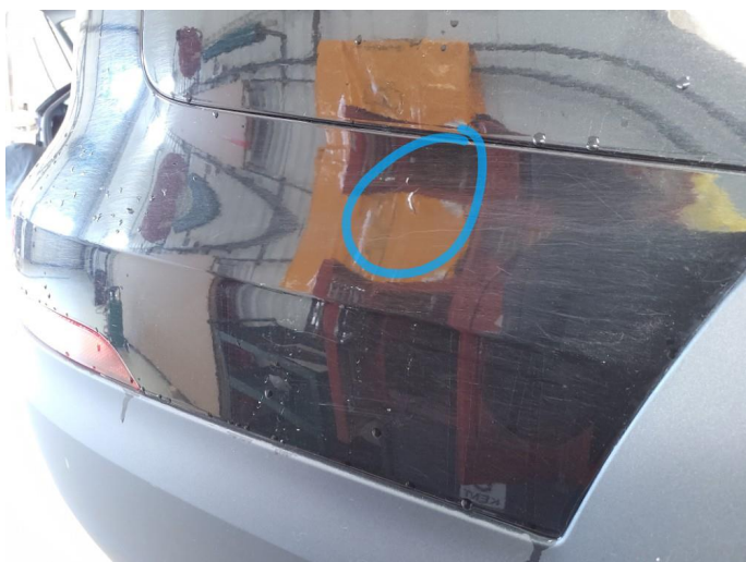
1.6 Ripe(r) ned til grunning