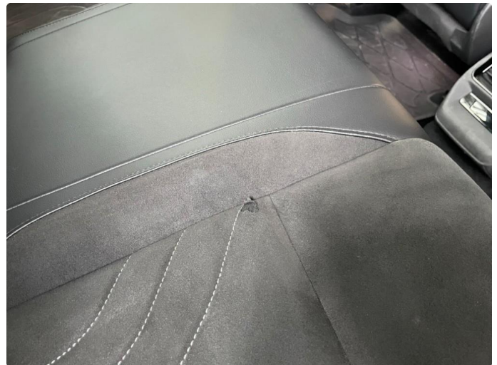
2.1 Skade setetrekk