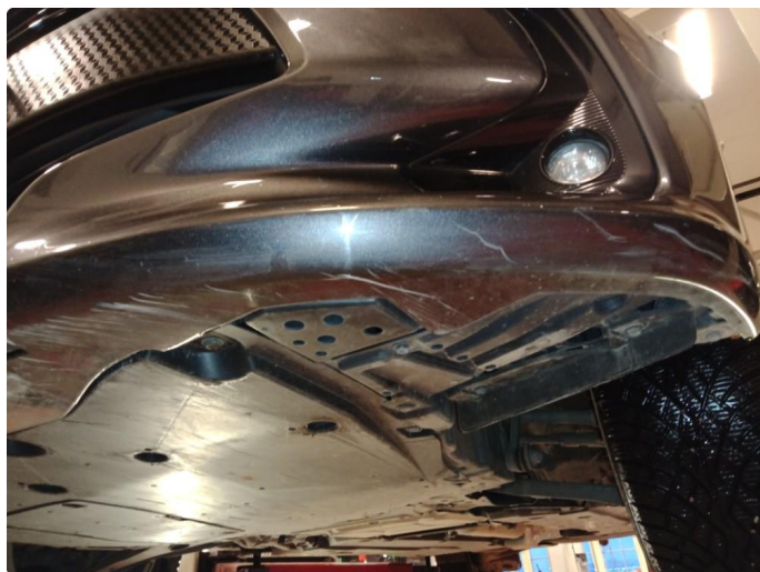
1.5 Mye riper støtfanger venstre foran nede. Noe små riper høyre foran Pris: 4410. Lakk 10 000-15 000