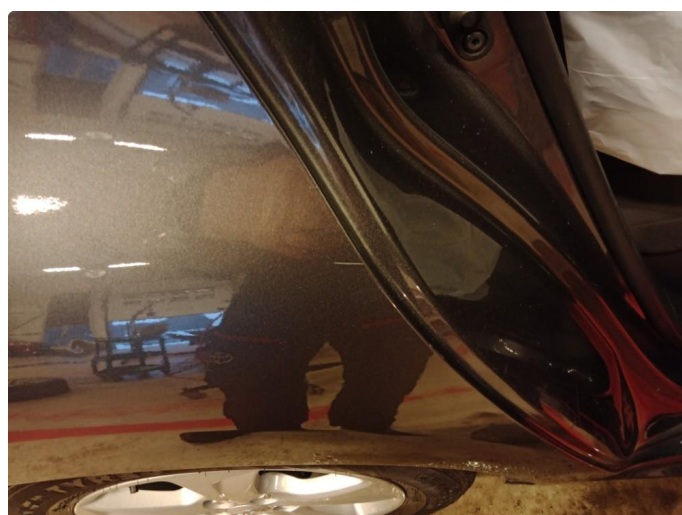
1.3 Riper side skjerm