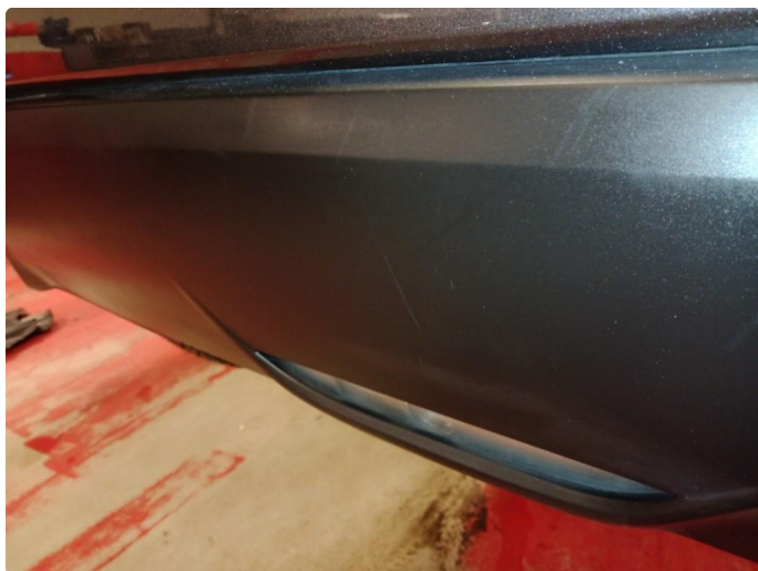
1.7 Diverse små riper på deksel på bakfanger