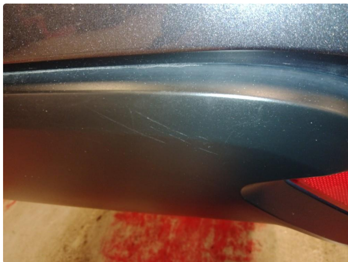
1.7 Diverse små riper på deksel på bakfanger