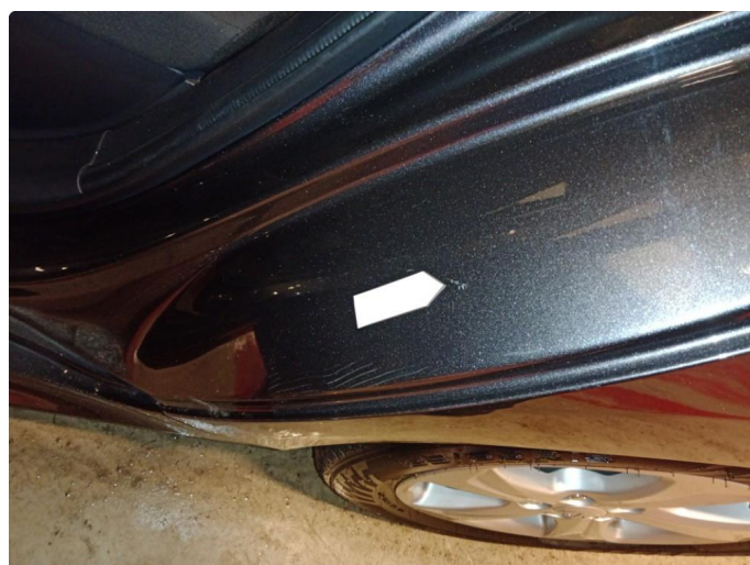
1.4 Små riper med liten bulk høyre side bak Små riper med ripec ned til grunning venstre side bak