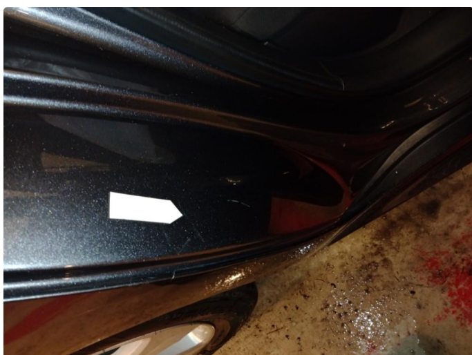
1.4 Små riper med liten bulk høyre side bak Små riper med ripec ned til grunning venstre side bak