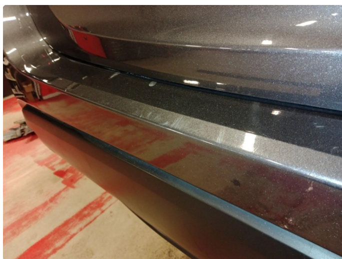
1.6 Diverse små riper på bakfanger Pris 3614 lakk 10 000-15 000