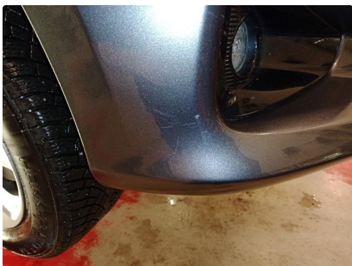
1.5 Mye riper støtfanger venstre foran nede. Noe små riper høyre foran Pris: 4410. Lakk 10 000-15 000