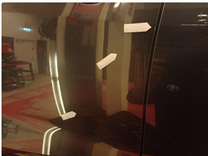
1.2 Små bulker Pris: 13 538 lakk 10 000