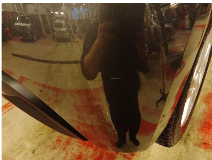
1.6 Diverse små riper på bakfanger Pris 3614 lakk 10 000-15 000