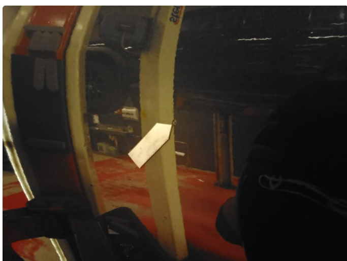
1.2 Små bulker Pris: 13 538 lakk 10 000