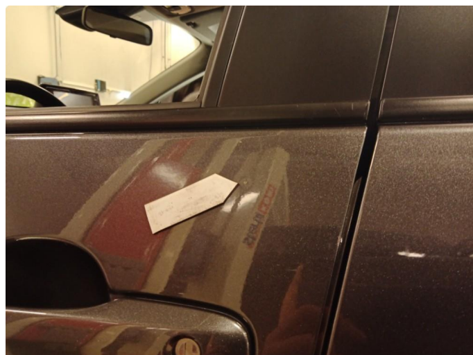
1.2 Små bulker Pris: 13 538 lakk 10 000