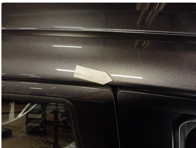
1.8 Steinsprut med lakkskade