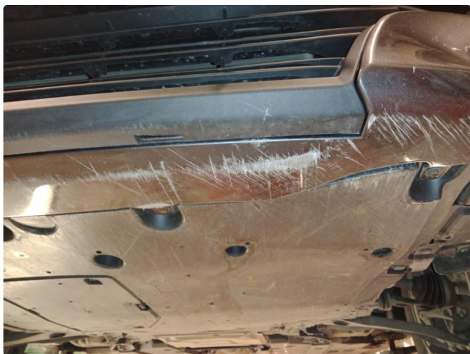
1.5 Mye riper støtfanger venstre foran nede. Noe små riper høyre foran Pris: 4410. Lakk 10 000-15 000