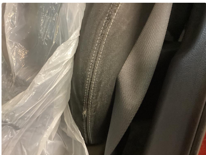
2.1 Små bruksmerker