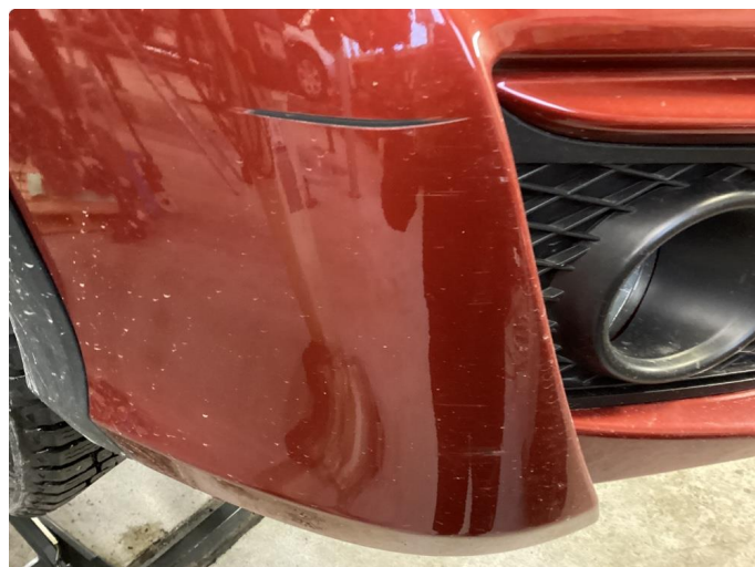
1.2 Ripe (normalt etter bilens alder)