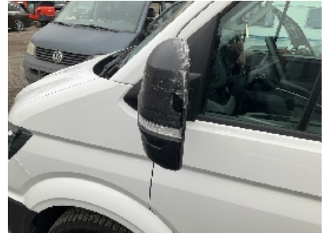
9. Utvendig speil