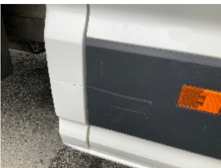
10. Lakk / karosseri utvendig