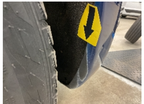
12. Lakk / karosseri utvendig