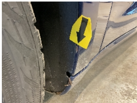
11. Lakk / karosseri utvendig