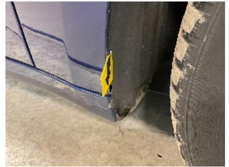
15. Lakk / karosseri utvendig