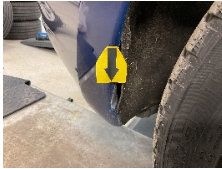
14. Lakk / karosseri utvendig