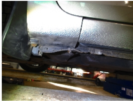
2. Venstre kanal