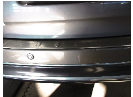
18. Støtfanger bak