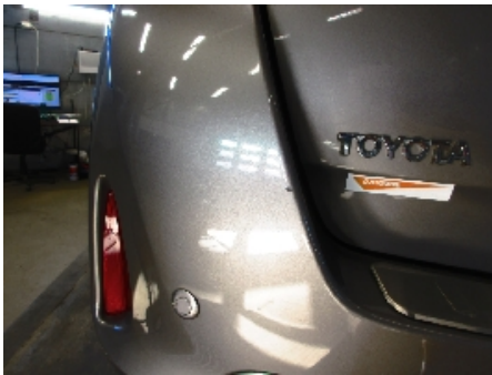
16. Støtfanger bak