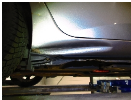
5. Høyre kanal