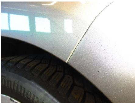
19. Venstre bakskjerm