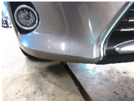
11. Støtfanger foran