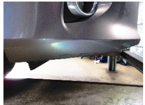
12. Støtfanger foran