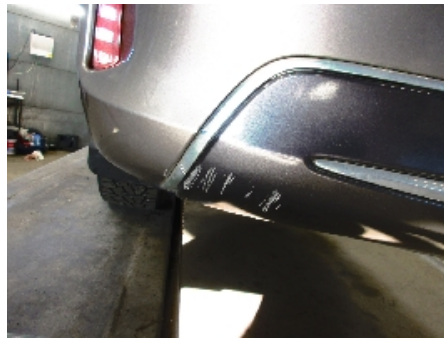
17. Støtfanger bak