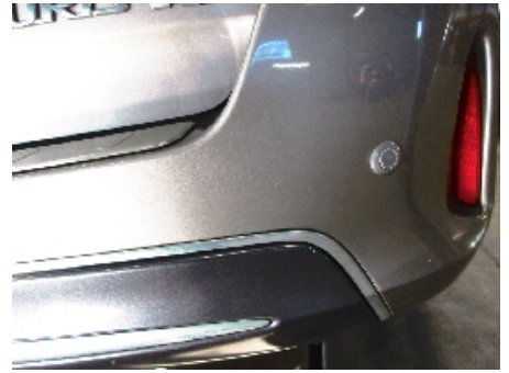
15. Støtfanger bak