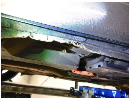
4. Høyre kanal