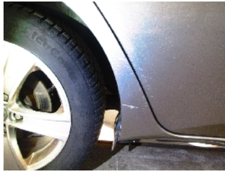
14. Høyre bakskjerm