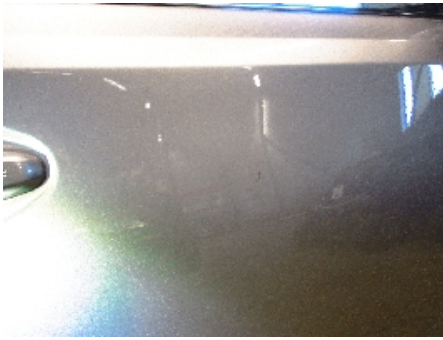
13. Høyre fordør