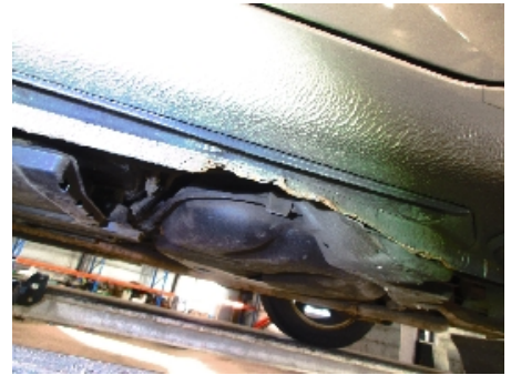
3. Venstre kanal