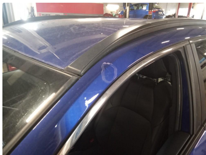
1.5 Ripe(r) ned til grunning