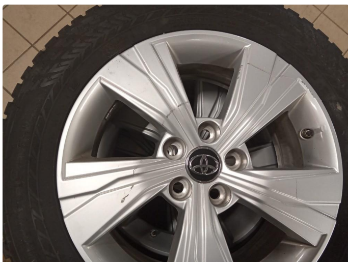
1.3 Skade på felg