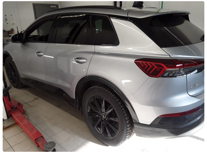
2.1 Øvrig opplysninger