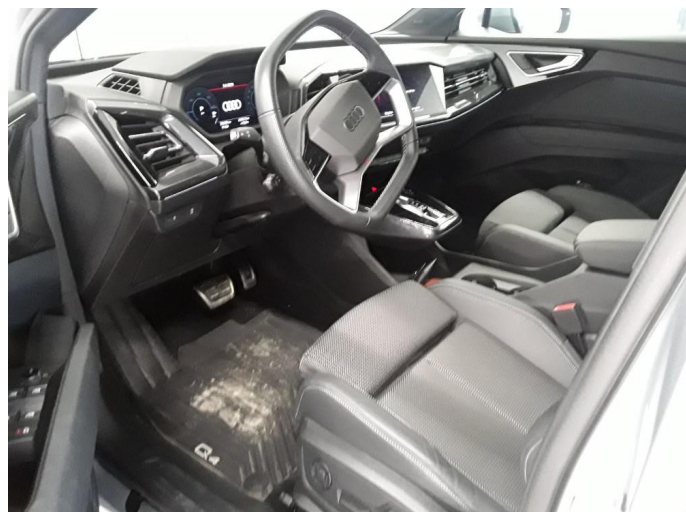
2.1 Øvrig opplysninger