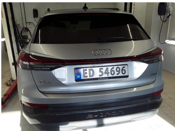
2.1 Øvrig opplysninger