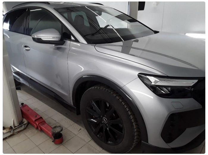
2.1 Øvrig opplysninger