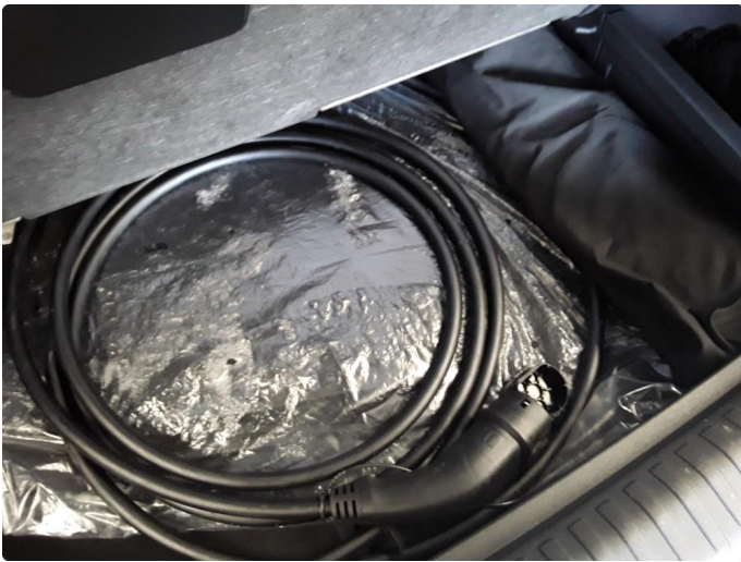
2.1 Øvrig opplysninger