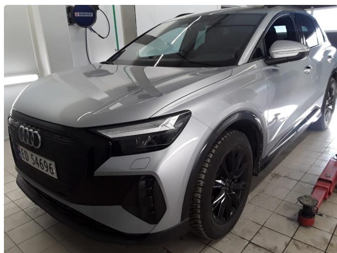
2.1 Øvrig opplysninger