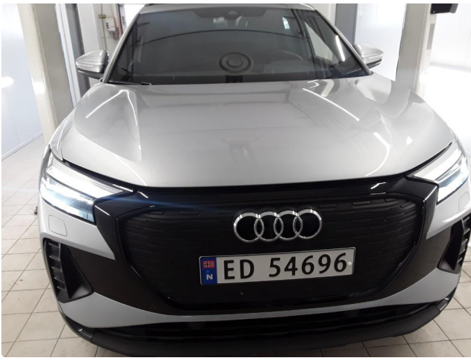
2.1 Øvrig opplysninger