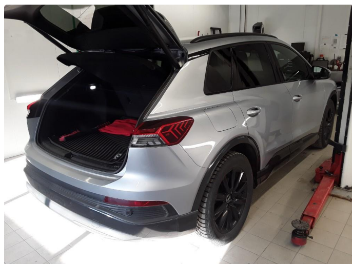
2.1 Øvrig opplysninger