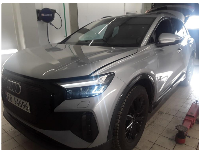
2.1 Øvrig opplysninger