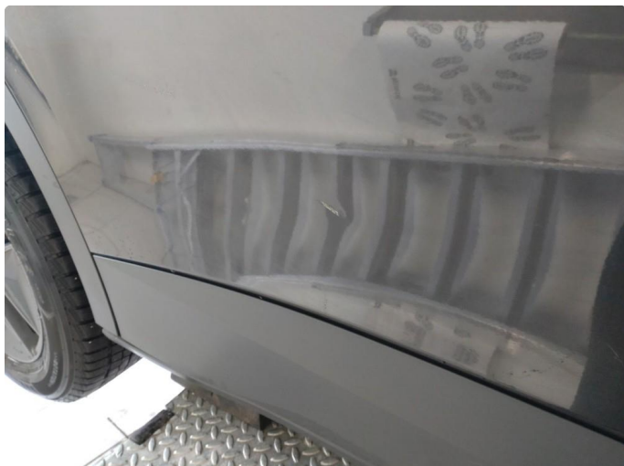
1.1 Bulk med lakkskade