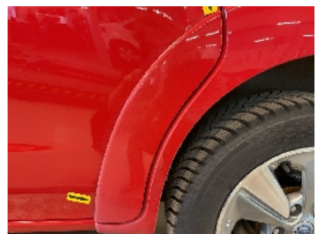
24. Lakk / karosseri utvendig