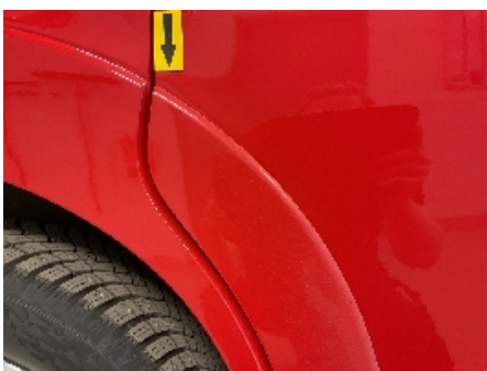
22. Lakk / karosseri utvendig