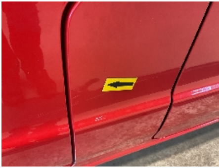
25. Lakk / karosseri utvendig