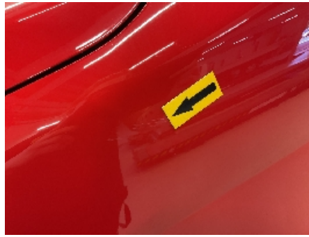
26. Lakk / karosseri utvendig