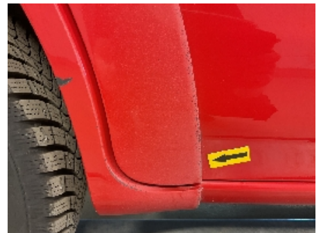
21. Lakk / karosseri utvendig