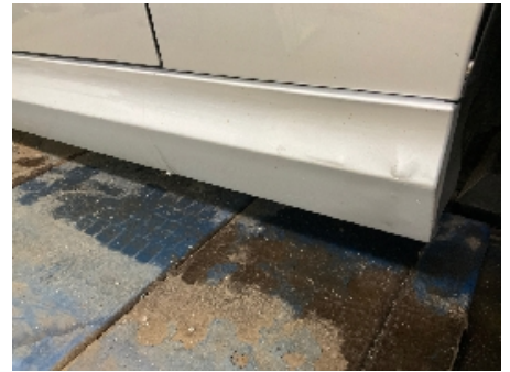
3. Lakk / karosseri utvendig