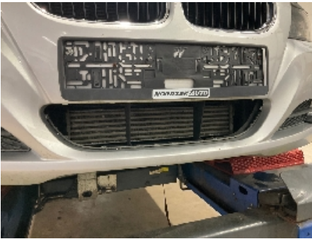
1. Lakk / karosseri utvendig