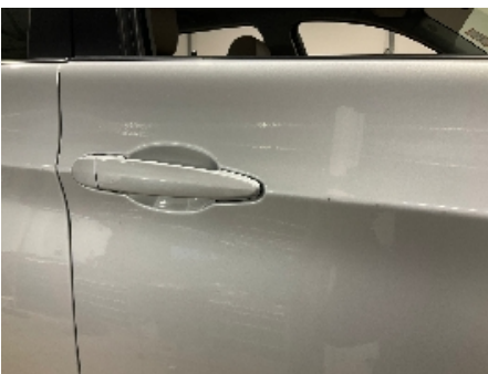
4. Lakk / karosseri utvendig