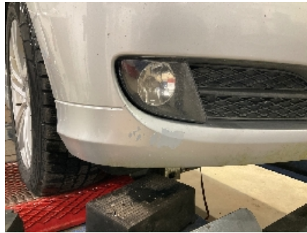
2. Lakk / karosseri utvendig