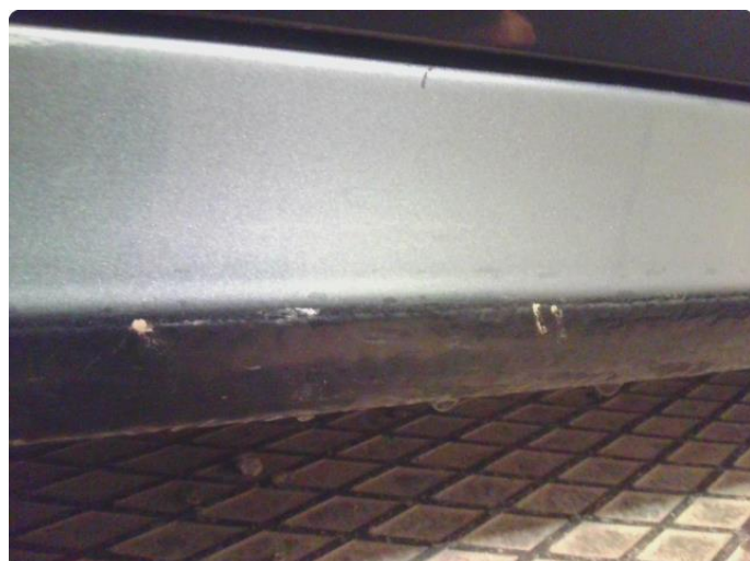
1.4 Ripe(r) ned til grunning