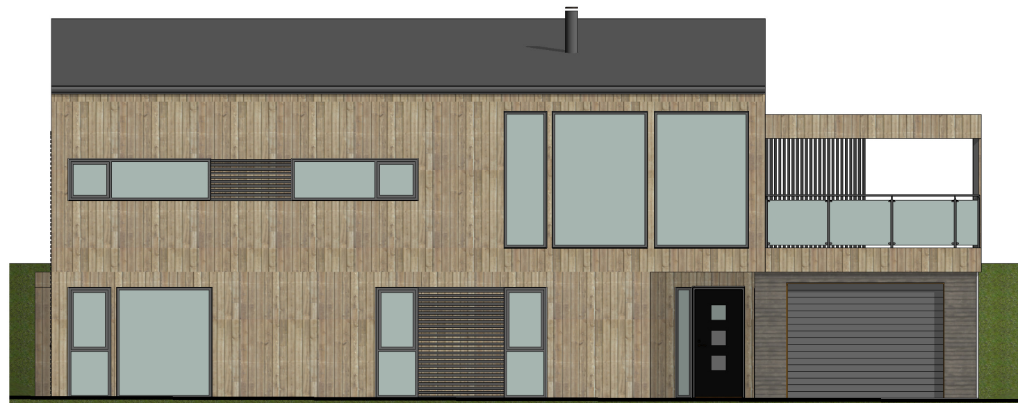
FASADE 1 1 : 100