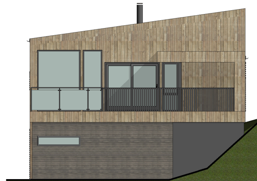
FASADE 2 1 : 100