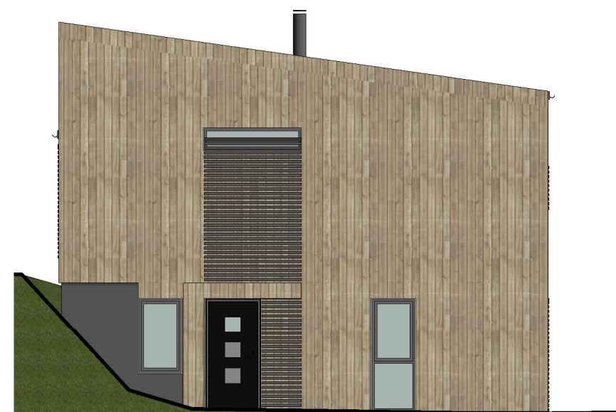
FASADE 4 1 : 100