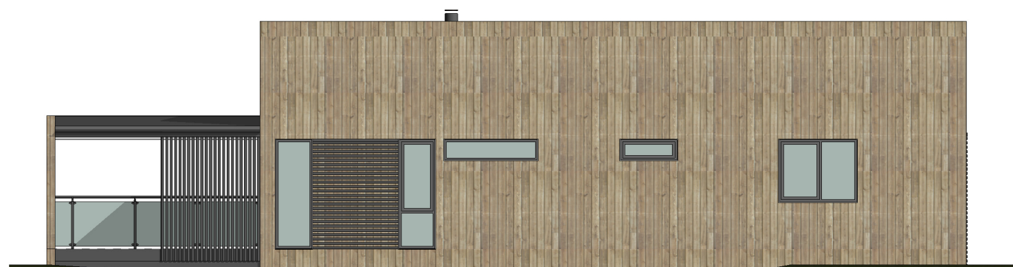
FASADE 3 1 : 100