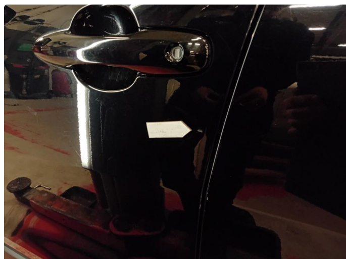
1.2 Bulk i dør.23000kr.