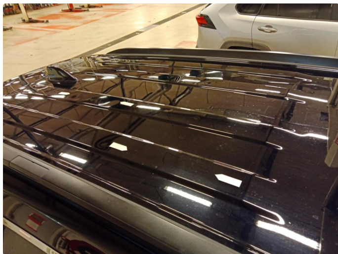
1.4 Flere bulker i tak.74000kr.