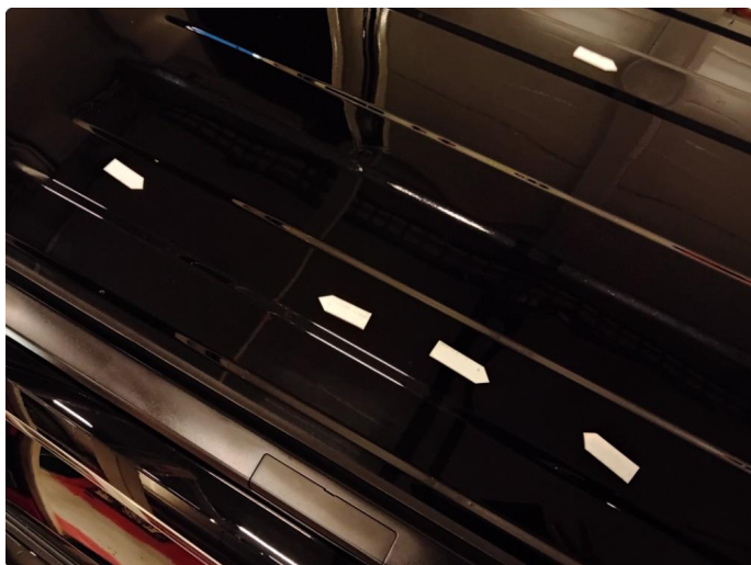
1.4 Flere bulker i tak.74000kr.