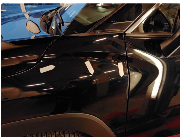
1.3 Riper i skjerm.6000kr