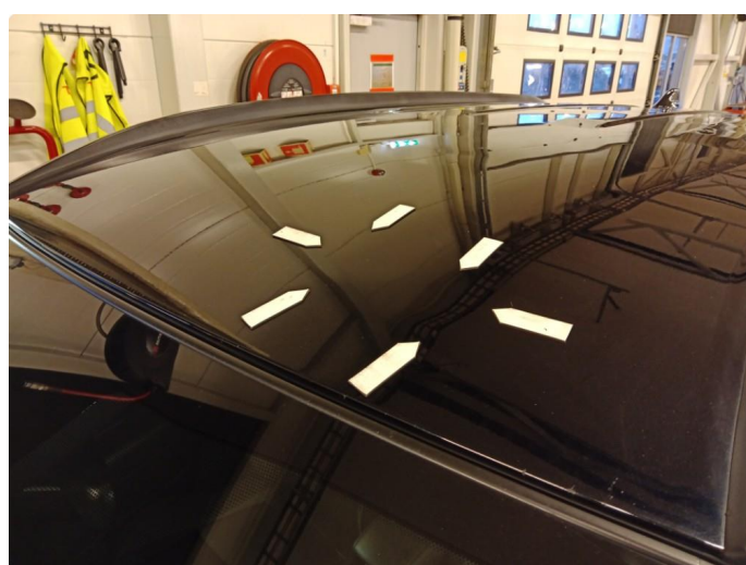
1.4 Flere bulker i tak.74000kr.