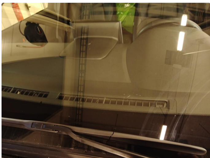
1.5 Steinsprutskader i frontrute. Må skiftes.37000kr