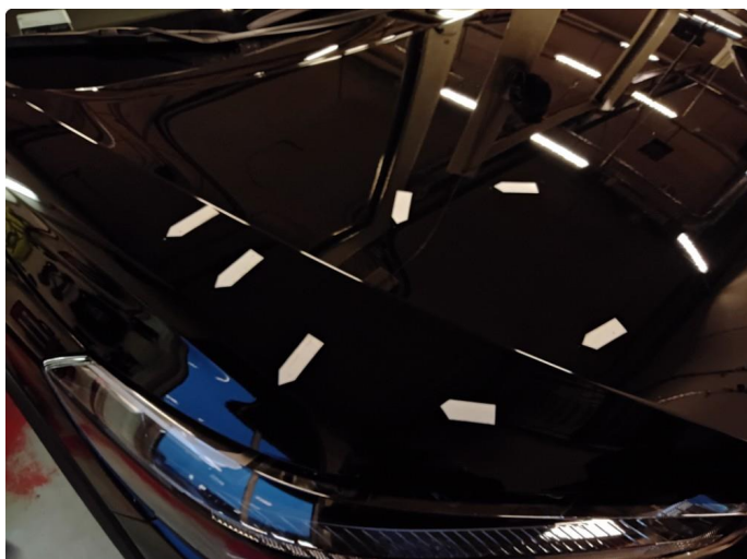
1.1 Unormalt mye steinsprut.18000kr.