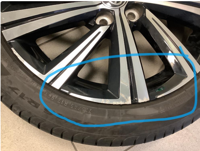
1.1 2 kantkjørte felger Diamond Cut