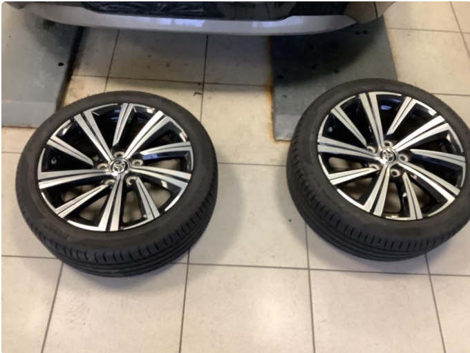
1.1 2 kantkjørte felger Diamond Cut