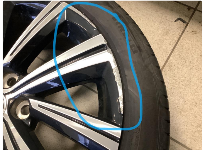
1.1 2 kantkjørte felger Diamond Cut