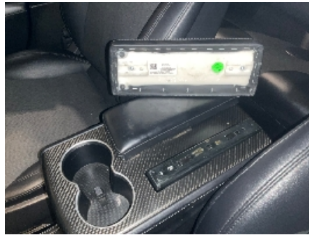
38. Dashbord / midtkonsoll