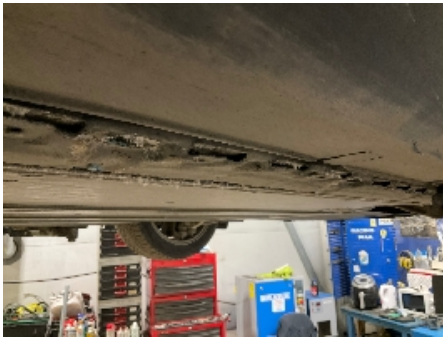
13. Utv. tilstand fremdriftsbatteri elbil/hybrid