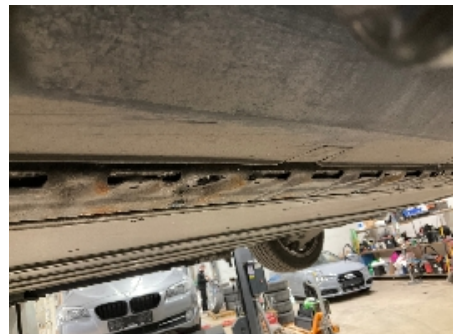
12. Utv. tilstand fremdriftsbatteri elbil/hybrid