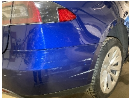
26. Lakk / karosseri utvendig