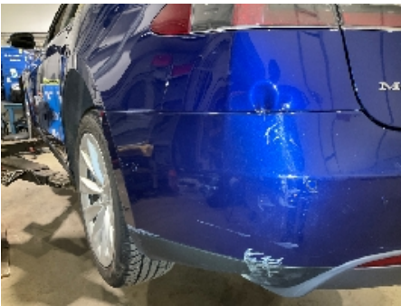
28. Lakk / karosseri utvendig