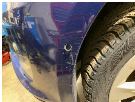
23. Lyd / lyssignaler