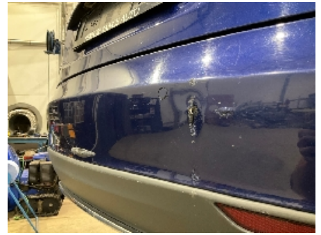
27. Lakk / karosseri utvendig