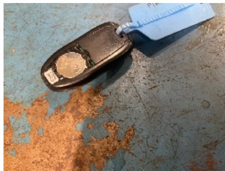
41. Nøkler / Utstyr