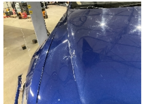
21. Lakk / karosseri utvendig