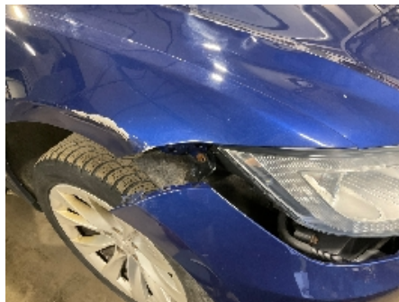
20. Lakk / karosseri utvendig