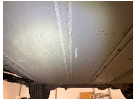
15. Utv. tilstand fremdriftsbatteri elbil/hybrid