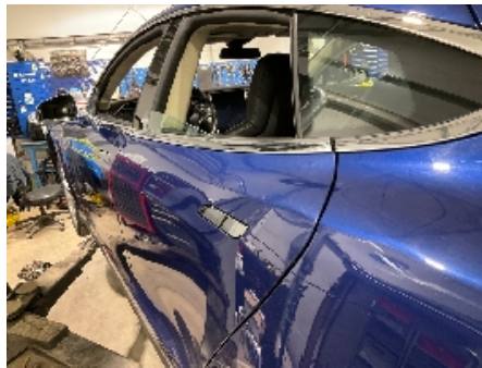
29. Lakk / karosseri utvendig