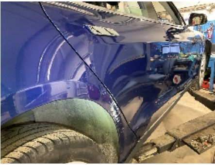
25. Lakk / karosseri utvendig