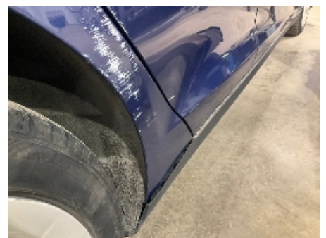
36. Lakk / karosseri utvendig