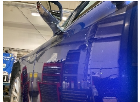
30. Lakk / karosseri utvendig