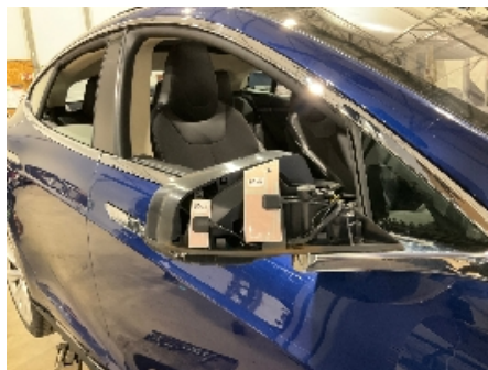
17. Utvendig speil