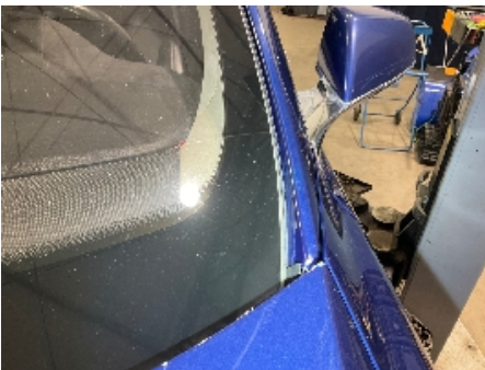
31. Lakk / karosseri utvendig