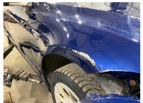
24. Lakk / karosseri utvendig