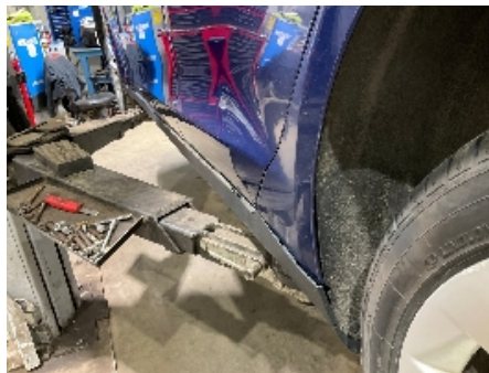
32. Lakk / karosseri utvendig