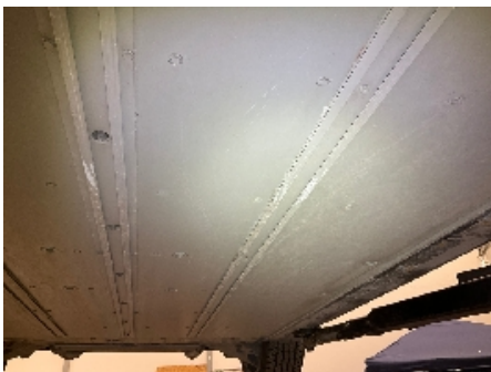
16. Utv. tilstand fremdriftsbatteri elbil/hybrid