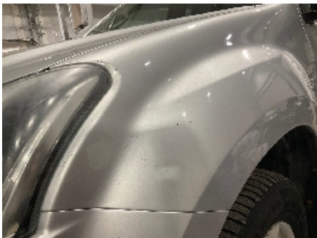
10. Lakk / karosseri utvendig