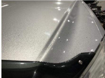
8. Lakk / karosseri utvendig