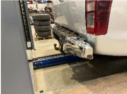
7. Lakk / karosseri utvendig