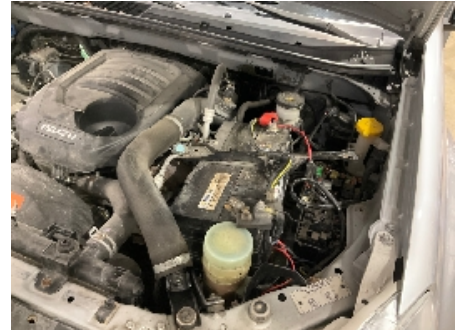
9. Batteri ytre tilstand