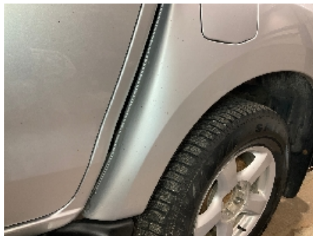
11. Lakk / karosseri utvendig