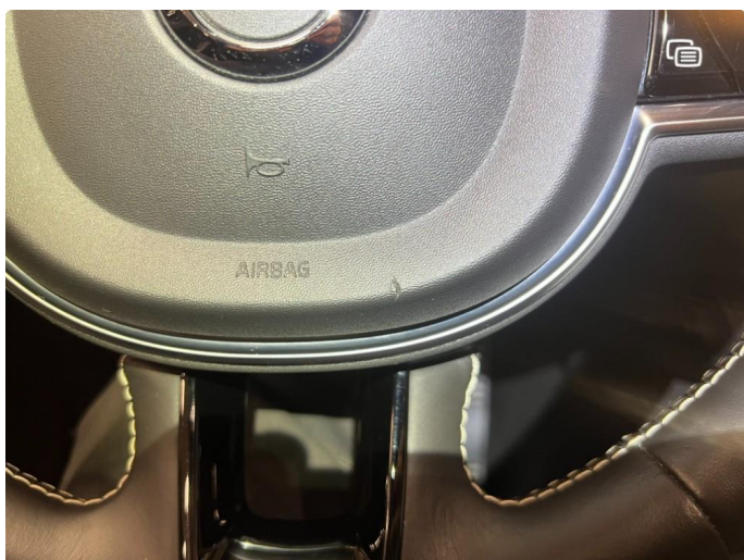
2.1 Merke på ratt