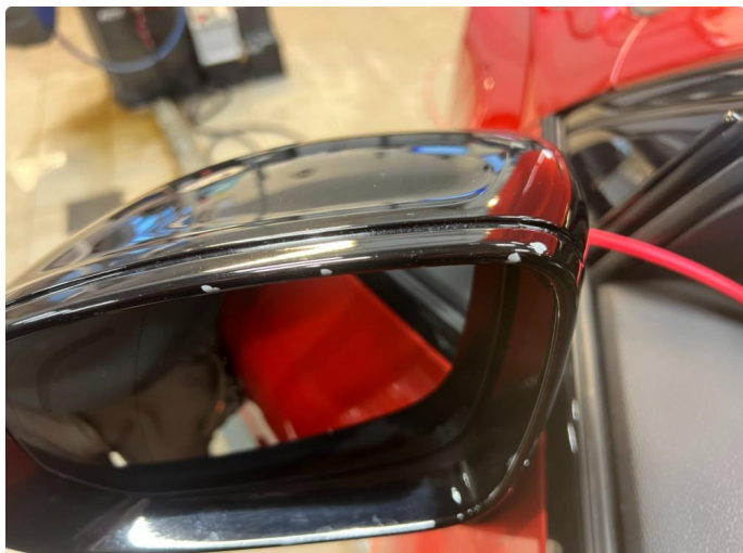
1.1 Merke på speil kåpe