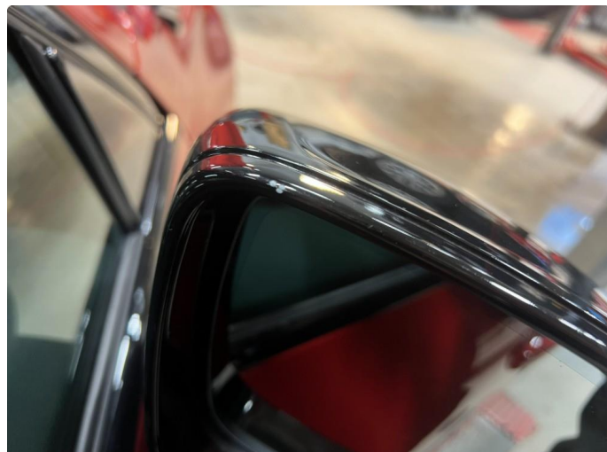
1.1 Merke på speil kåpe