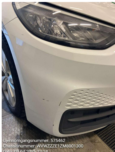
1.1 Riper - penslet