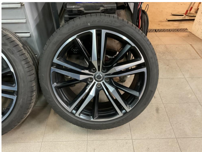
1.3 Bilder av sommerhjul vedlagt