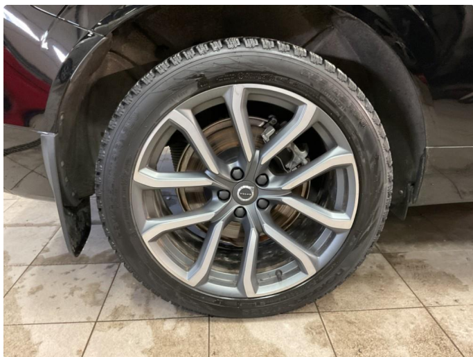
1.4 Bilder av vinterhjul vedlagt