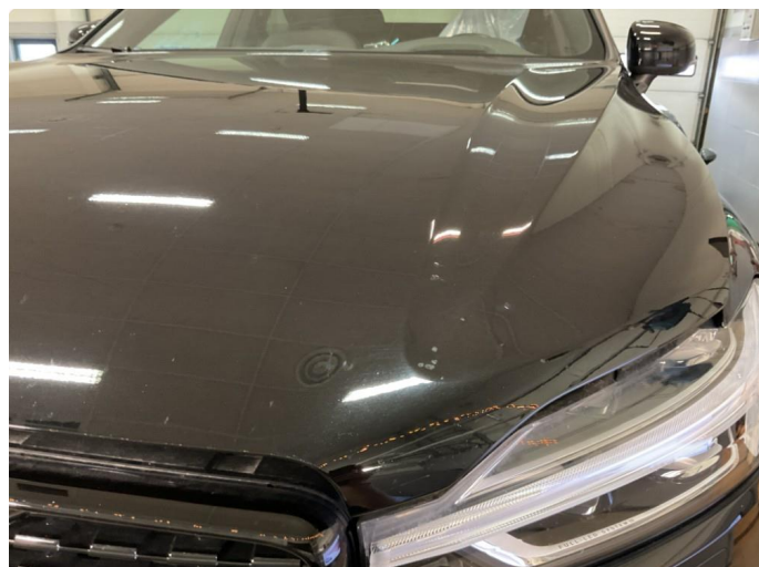
1.1 Noe steinsprut på panser