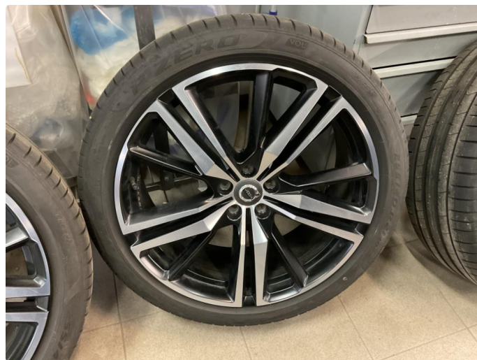
1.3 Bilder av sommerhjul vedlagt