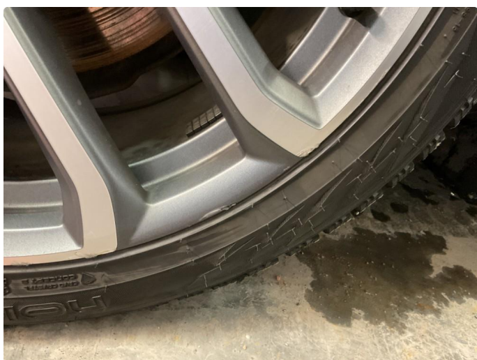
1.2 2 stk vinterfelg noe kantkjørt