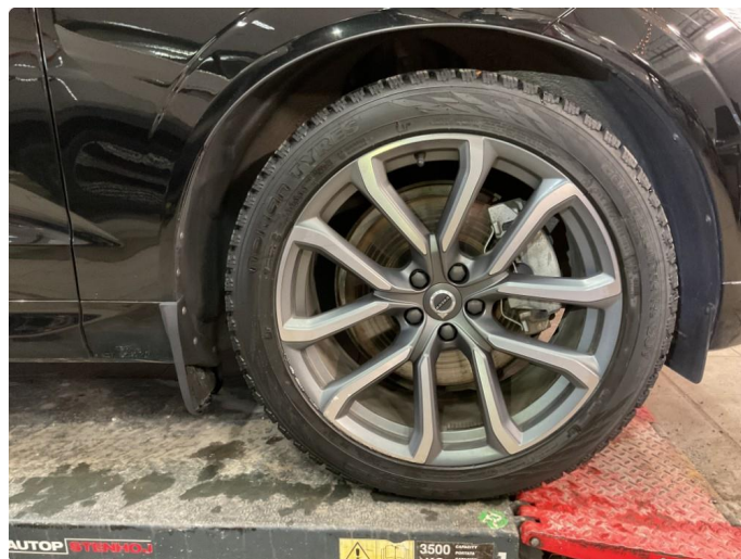
1.4 Bilder av vinterhjul vedlagt