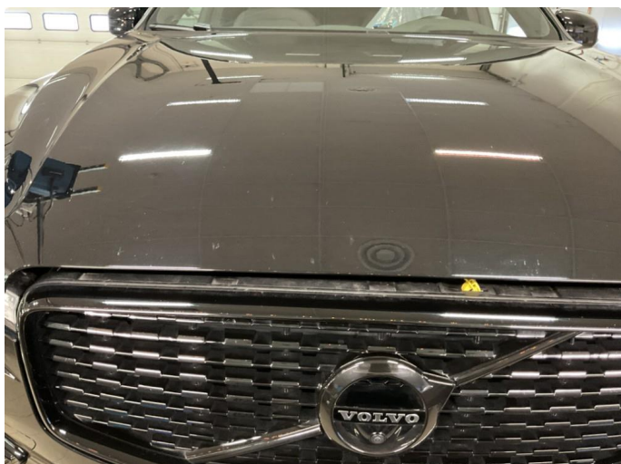
1.1 Noe steinsprut på panser