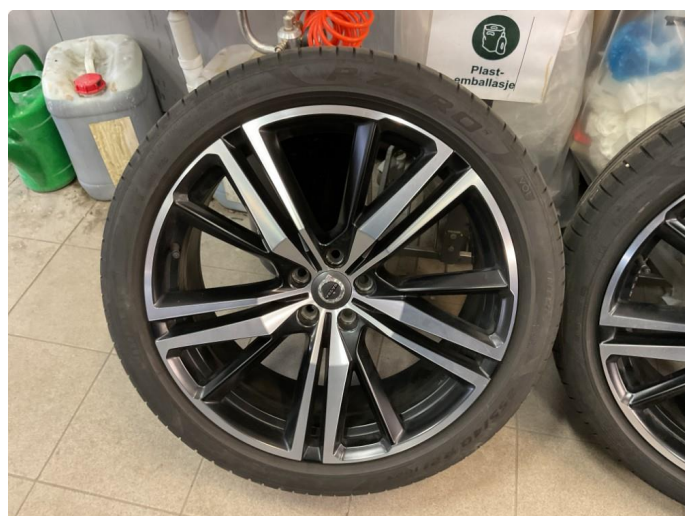
1.3 Bilder av sommerhjul vedlagt