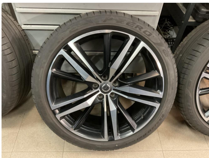
1.3 Bilder av sommerhjul vedlagt