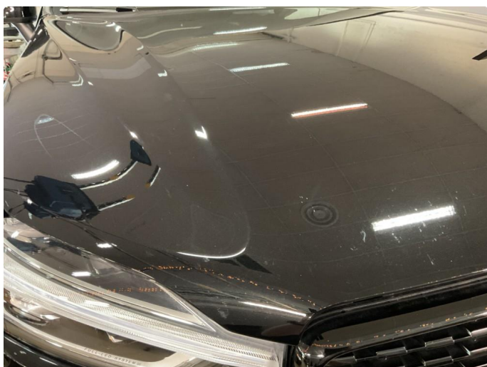
1.1 Noe steinsprut på panser