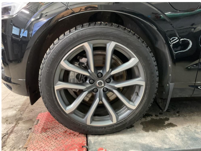
1.4 Bilder av vinterhjul vedlagt