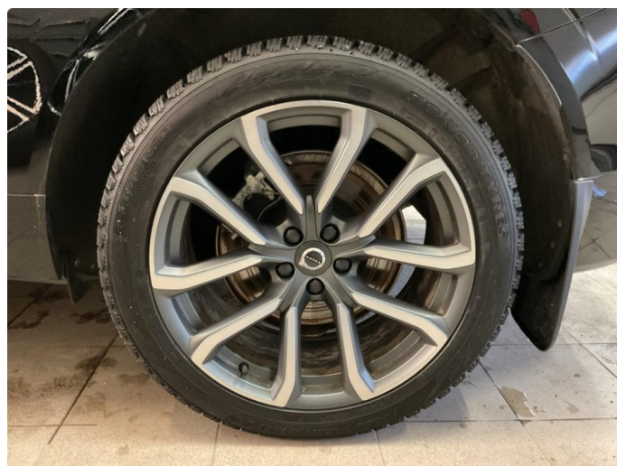
1.4 Bilder av vinterhjul vedlagt