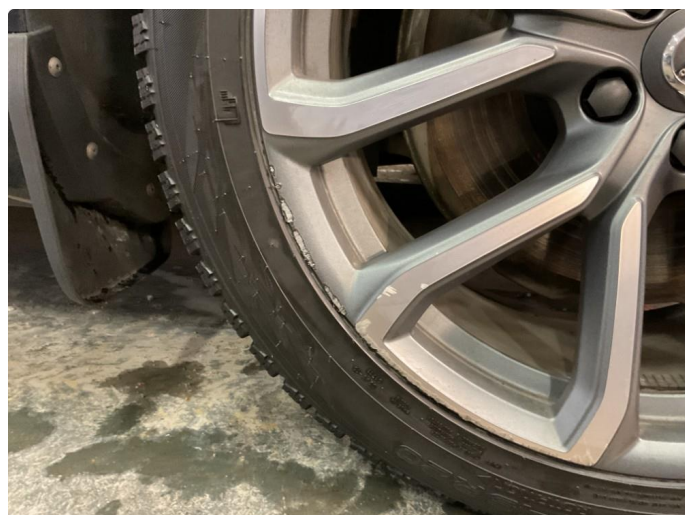
1.2 2 stk vinterfelg noe kantkjørt