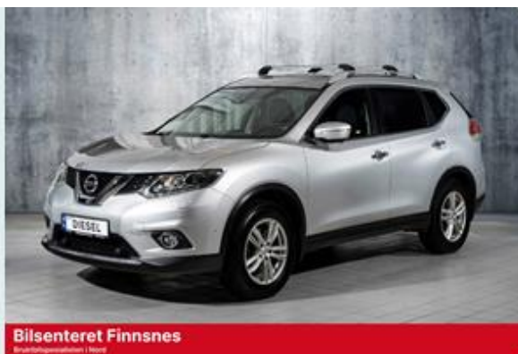
Bilsenteret Finnsnes Bruttoverdi ekskl. mva. | Nær

Se mer om forutsetningene for vurderingen og andre vilkår på siste side.