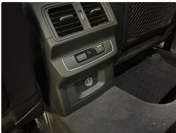
3.1 Selges uten dummy for sigarett-tenner til baksete