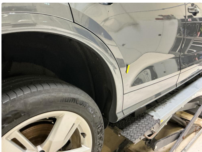
1.2 Skade høyre dører og skaper hjulbuelist bak