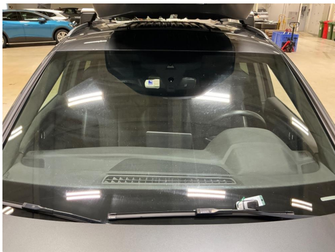
1.4 Slitt frontrute