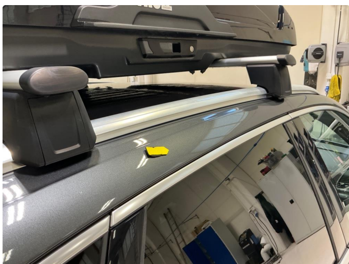
1.3 Bulk høyre og venstre takvange