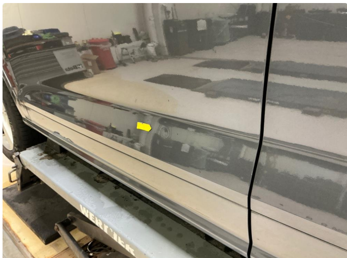
1.1 Parkeringsbulk venstre fordør