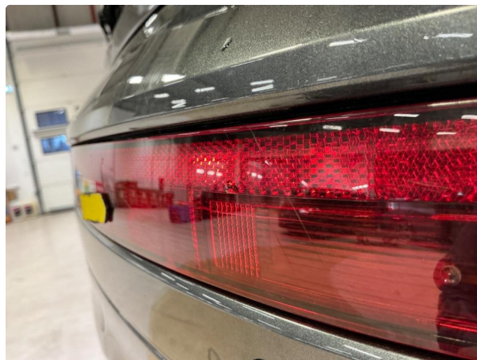
2.1 Krakelering i plast nedre lykt høyre side i støtfangerkappe bak