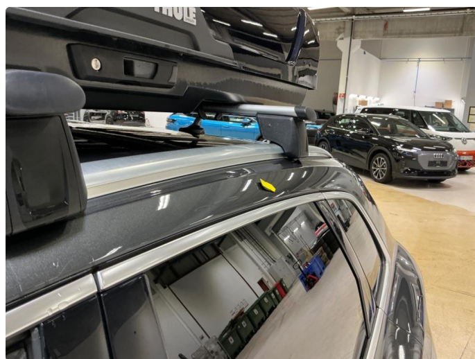
1.3 Bulk høyre og venstre takvange