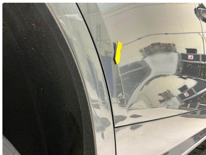
1.2 Skade høyre dører og skaper hjulbuelist bak