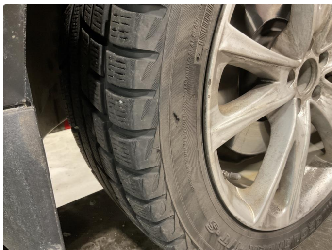
1.2 Dekkskade vinterhjul